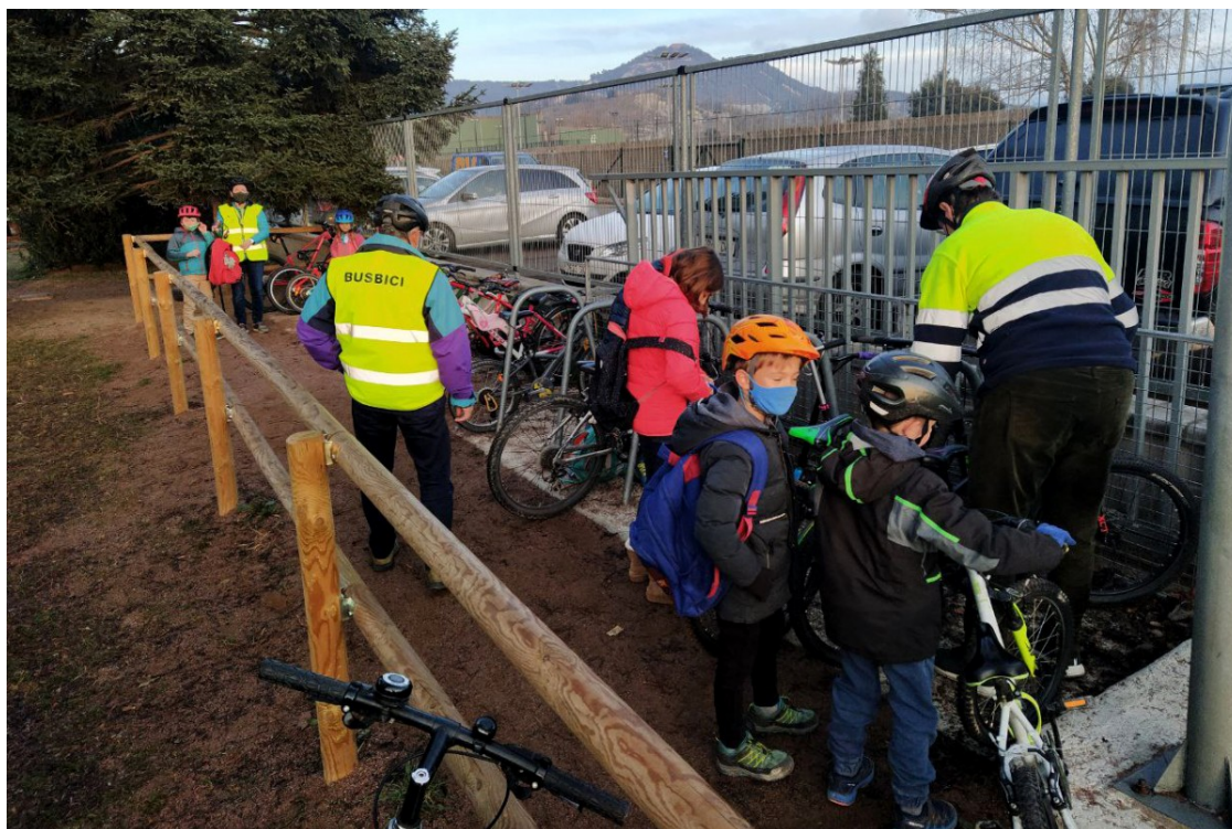
Aparcament per a bicicletes a l'escola Andersen de Vic | Osona amb bici

Article d'Osona amb bici a partir dels decebedors resultats de la diagnosi que ha fet sobre els aparcaments per a bicicleta als equipaments públics de Vic | «Dels 84 equipaments analitzats, 19 (un 23%) no tenen cap aparcament per a bicicleta, entre els quals la Clínica de Vic, el CAP del Remei o el Recinte Firal del Sucre»