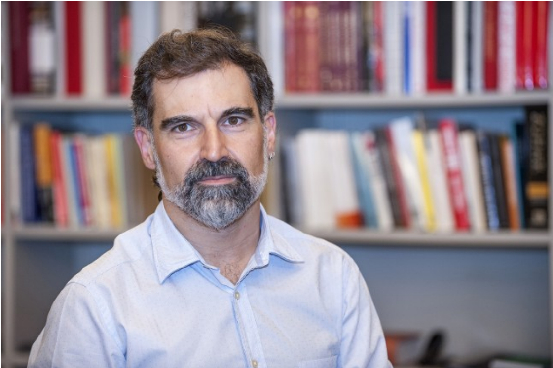
Jordi Cuixart, president d'Òmnium Cultural