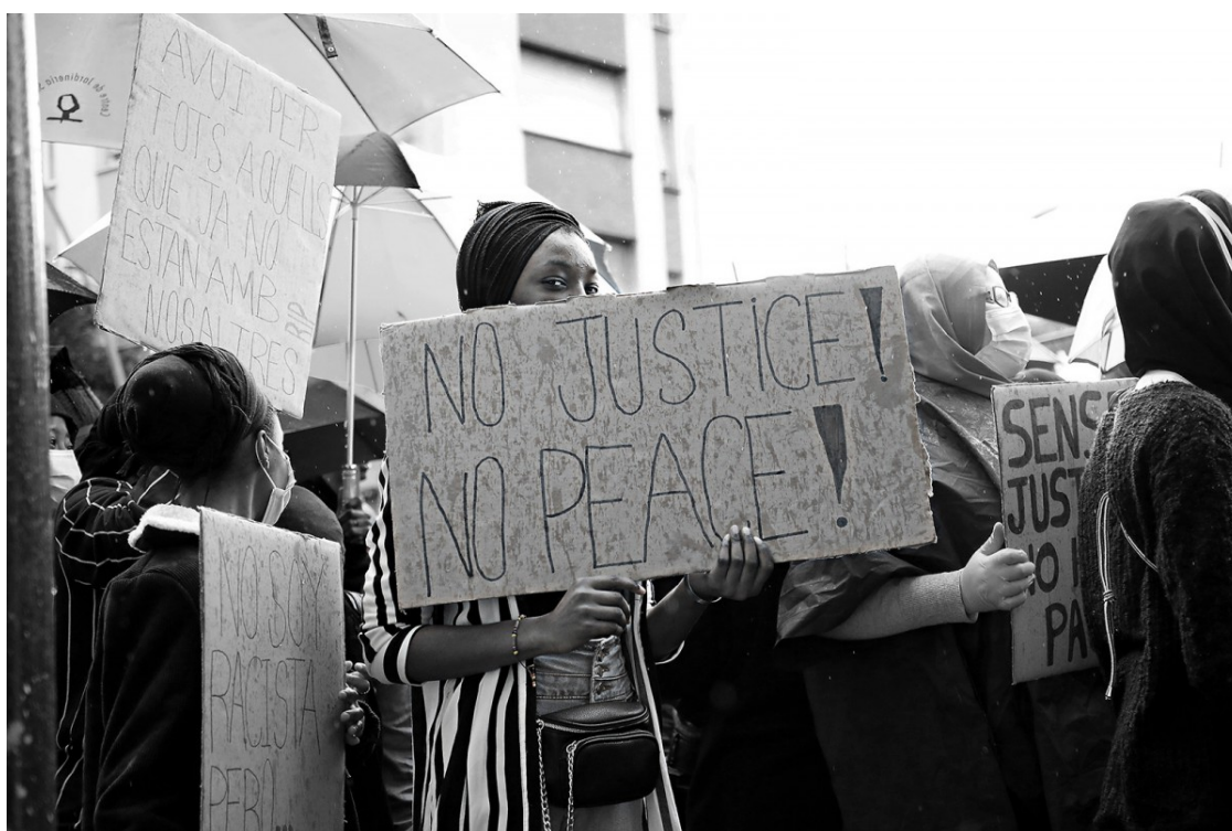
Manifestació del moviment #BlackLivesMatter a Salt | Aleix Auber

Selecció de 10 articles publicats aquest any a Setembre, sobre la Covid-19, però també l'emergència climàtica, la lluita antifeixista, l'economia solidària o la cultura com a salvaguarda i refugi