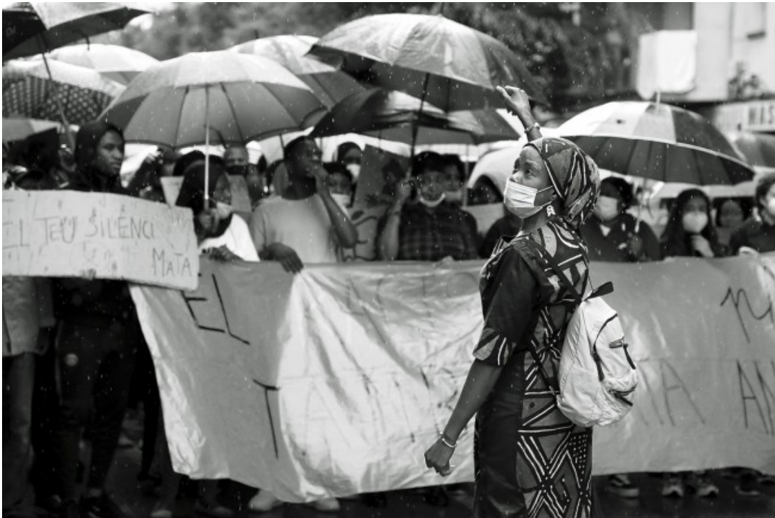
Manifestació del moviment #BlackLivesMatter a Salt