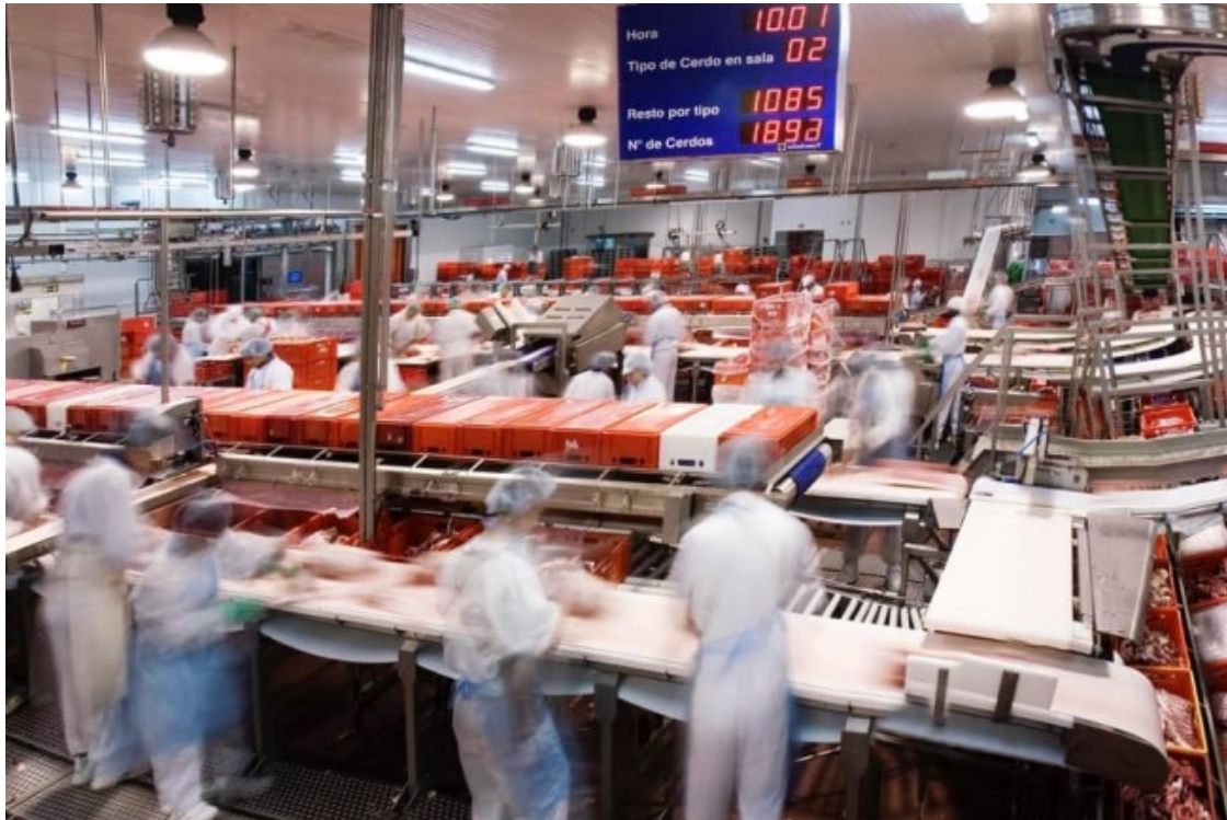
Planta de producció de Patel, del grup Vall Companys, a Sant Martí Sescorts