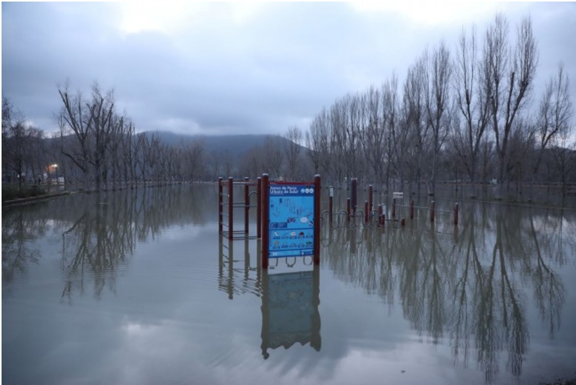
Efectes del Glòria al parc de la Draga de Banyoles