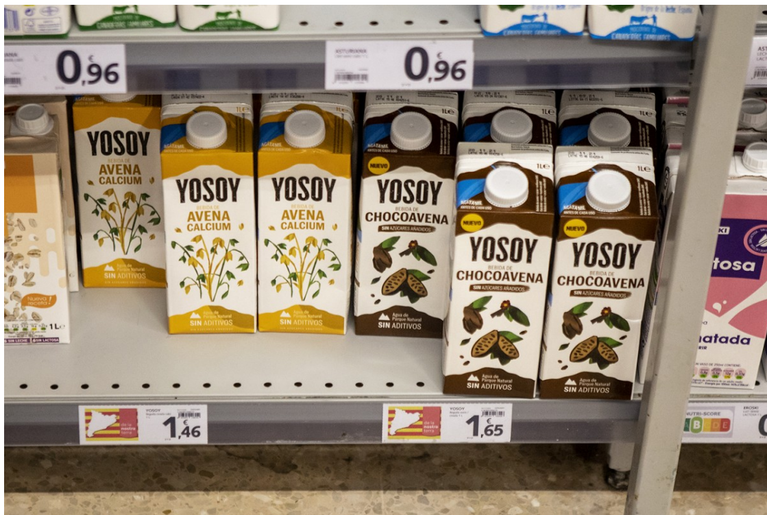
Productes de la marca Yosoy, propietat de l'empresa Líquats Vegetals, en un supermercat | Víctor Serri

L'empresa Líquats Vegetals S.A. vol perforar 28 pous ?alguns en zones naturals protegides? i extreure'n aigua perquè la seva fàbrica de Viladrau augmenti exponencialment la producció de les begudes que comercialitzen rere les marques Yosoy, Monsoy i Almendrola, entre d'altres | Entitats veïnals i ecologistes denuncien que el projecte acabarà amb el cabal de la riera Major del Montseny, un dels cursos fluvials més ben conservats de Catalunya