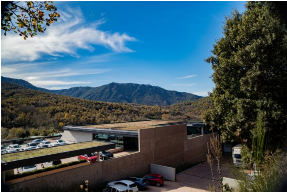
Fàbrica de Lluçanes Vegetals a l'entrada de Viladrau, al peu de la cara nord del Parc Natural del Montseny