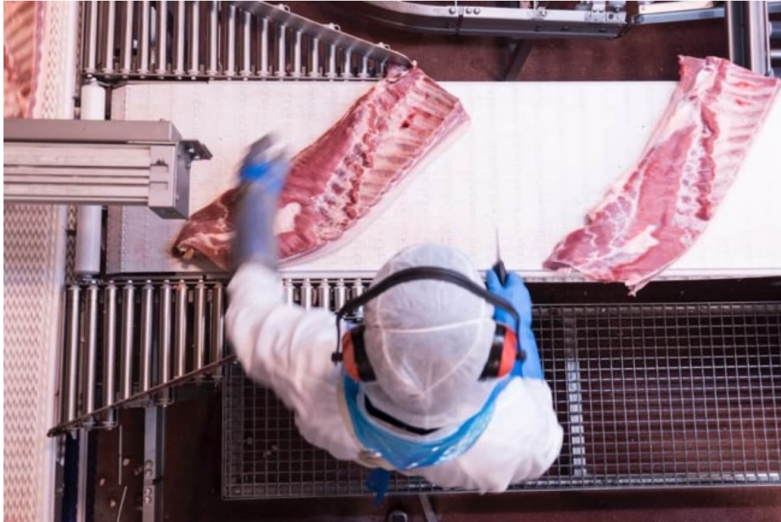
Un operari manipulant la carn a la planta de producció de Patel de Sant Martí Sescorts

La clau d'aquest creixement al llarg de 2019 cal buscar-la, segons el diari econòmic, en l'increment de la demanda de carn de porc procedent de la Xina, on un de cada quatre porcs està sent víctima d'un brot de pesta porcina. Pel que fa als beneficis, l'última dada disponible és la de 2018, amb un benefici net de 73 milions d'euros.