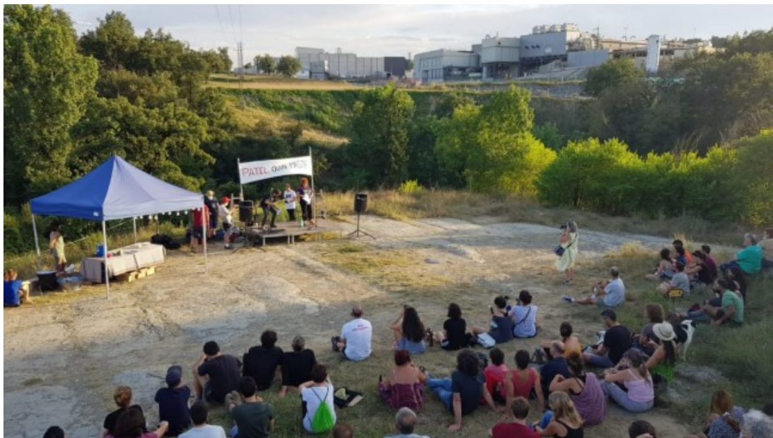
Acte reivindicatiu del GDT amb motiu de la presentació de la denúncia contra Patel. Al fons, l'escorxador

Patel ha estat notícia en els últims mesos per dos fets puntuals més. Per una banda, la important ampliació que li va aprovar l'Ajuntament de l'Esquirol i que s'ha dut a terme durant els anys 2019 i 2020. En concret, s'ha construït a tocar de l'escorxador un nou magatzem de set pisos per a la congelació de la carn provinent de la sala de desfer de Patel, bona part de la qual es destina a l'exportació a l'estranger. El nou magatzem, amb una capacitat d'emmagatzematge de 6.000 tones de carn, representarà un important estalvi econòmic per l'empresa, que fins ara havia de recórrer a magatzems externs per a la conservació de la carn. Segons càlculs del GDT, l'ampliació, que també afectarà al traçat del camí ral de Vic a Olot, pràcticament duplica la superfície construïda de l'escorxador de Sant Martí Sescorts.