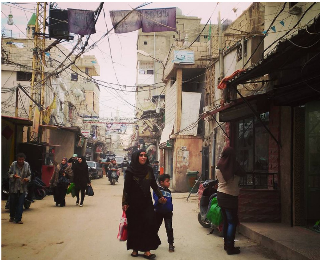
Camp de persones refugiades palestines Ein El Hilweh, al Líban | Laura Arau

Laura Arau explica, una setmana després de tornar del camp Ein El Hilweh, com la població palestina refugiada al Líban continua patint la discriminació institucional i la vulneració dels drets humans | A semblança dels murs que separen a Cisjordània i Gaza de la resta de la Palestina ocupada, el Líban està construint un mur al voltant del camp Ein El Hilweh