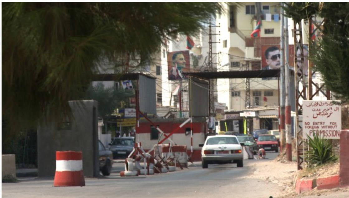
Punt de control a l'entrada del camp Ein El Hilweh

Actualment, el Líban acull a unes 470.000 persones refugiades de Palestina (un 10% del total de la seva població) repartides en 12 camps oficials. Alguns d'ells estan rodejats de parets de formigó armat i controlats per militars libanesos. Les pressions sobre aquests camps augmenten cada vegada més, convertint-los en guetos i transformant-los en els nous camps de concentració del segle XXI.