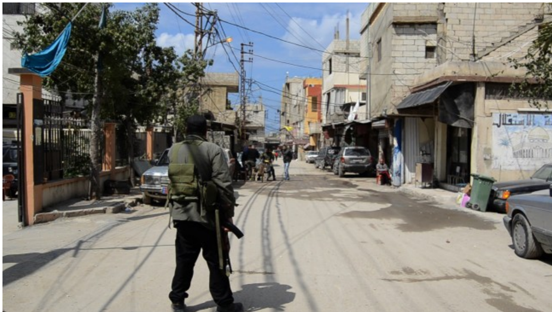
Homes armats al camp Ein El Hilweh