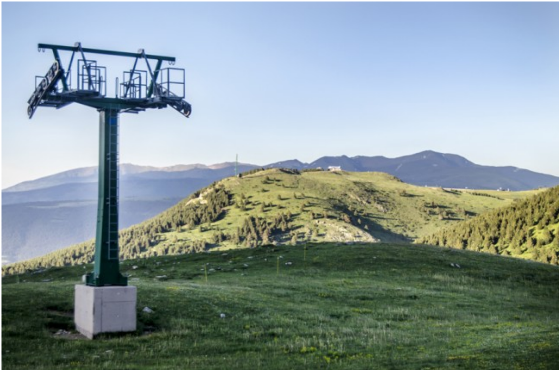
Imatge presa durant la construcció del telecadira Coll de Pal-La Molina