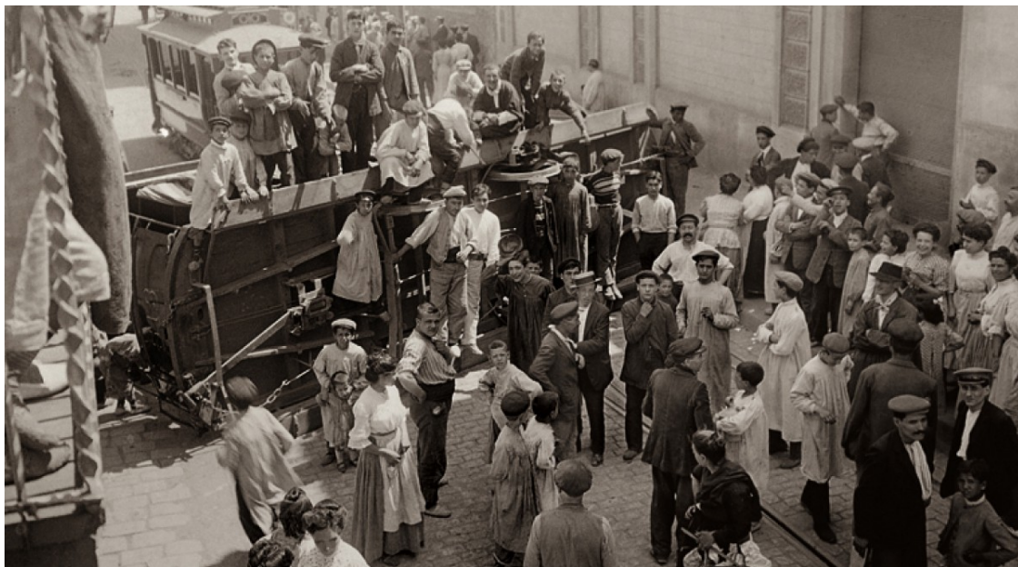
Barricada amb un tramvia bolcat durant les primeres hores de la revolta al barri de Gràcia de Barcelona

En el centenari de la Setmana Tràgica, recuperem aquest article de Jordi Martí Font sobre la revolta ocorreguda entre el 26 de juliol i el 2 d'agost de 1909 | «Què va passar a Barcelona ara fa cent anys? Què va abocar les masses de gent a cremar escoles religioses, esglésies i convents?»