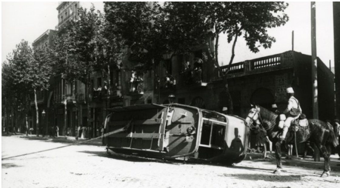
Soldat a cavall mirant un tramvia bolcat durant la Setmana Tràgica de 1909 a Barcelona

El 22 de juliol, el governador civil de Barcelona, Ángel Ossorio y Gallardo, prohibeix les manifestacions i incomunica Barcelona amb Madrid. El ministre de Governació, Juan de la Cierva, prohibeix els mítings i les manifestacions, alhora que ordena que es detingui tot aquell que protesti públicament. El dia 23, Solidaritat Obrera anuncia que declararà la vaga general contra la guerra el dilluns 26 de juliol. Malgrat l'anunci, la central obrera i llibertària no assumirà la direcció del moviment. Cal tenir en compte que, en aquell moment, arran d'una llei aprovada el 1855, es podia estar exempt del servei militar amb el pagament d'una indemnització de 1.500 pessetes de l'època. Si es pagaven, una altra persona ocupava la plaça del soldat cridat a quintes. Les 1.500 pessetes suposaven un salari complet d'un obrer de l'època, per la qual cosa anar a morir a la guerra esdevenia una qüestió de classe.