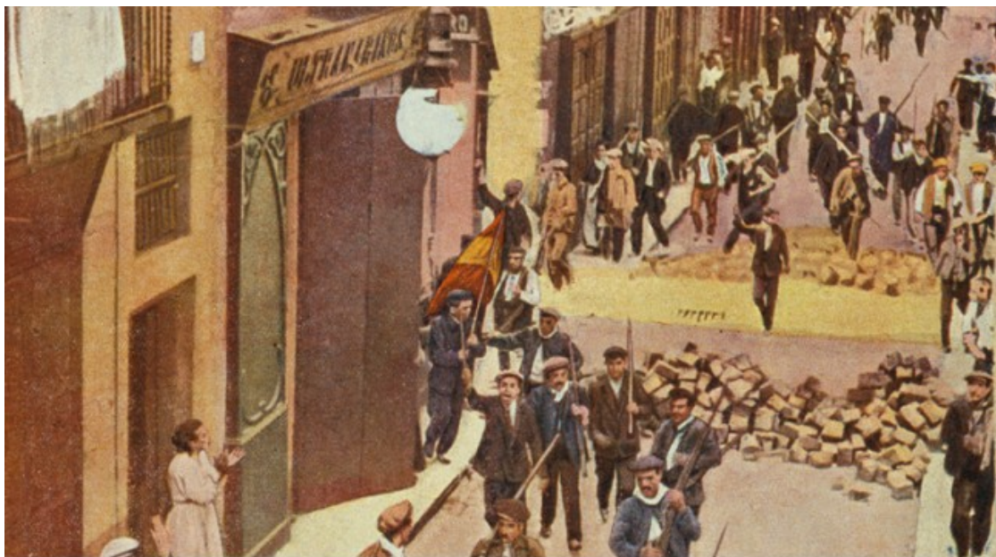
Il·lustració de l'assalt a la Caserna dels Veterans a 'La Actualidad', el 26 de juliol de 1910