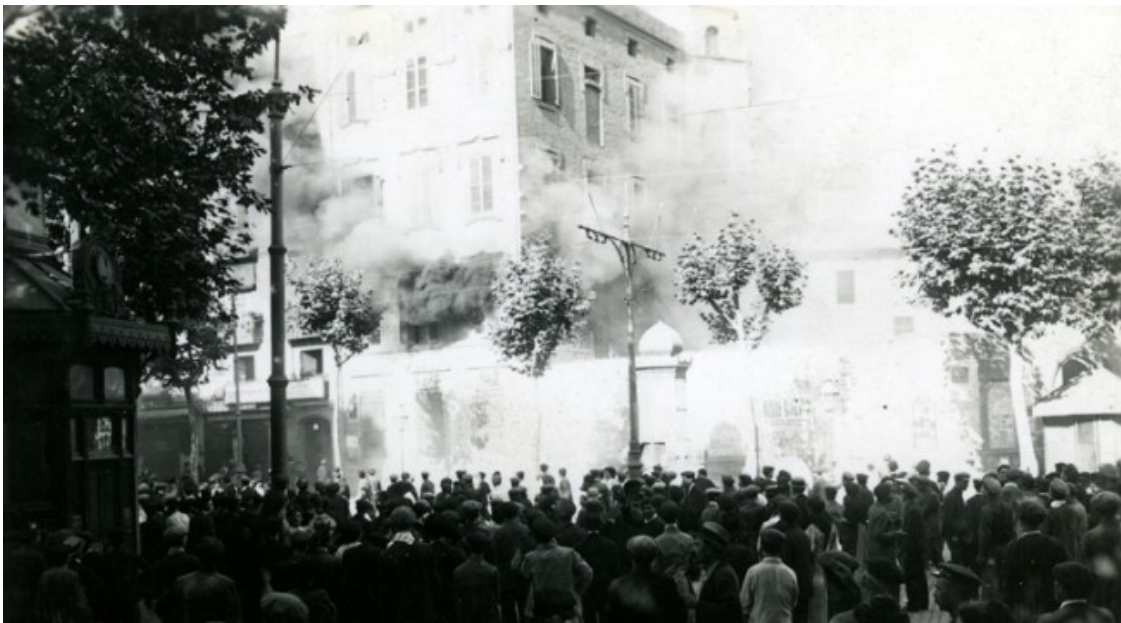
L'incendi dels Escolapis al barri de Sant Antoni de Barcelona

Coromines, que ja havia patit la repressió que va envoltar el Procés de Montjuïc, recorda en els seus diaris: «No tinc de penedir-me de res. No he fet cap acte del qual m'hagi d'averkonyir. Algun diari ha parlat de que volien agafar-me, un periodista m'ha dit que estava a la llista dels deportats». En una carta dirigida a Amadeu Vives, Coromines li resumeix les jornades dient que «el dilluns es va començar per una protesta contra la guerra, cridant 'viva els soldats'. Però la nit mateixa es va girar la cosa cap a la crema de convents" i "el poble, quasi per unanimitat, va trobar bé la protesta el primer dia. Després, la crema dels edificis religiosos va separar de la protesta els carlins i els conservadors». «No creguis lo que diuen de robos, violacions i assassinats dels revolucionaris. Als maristes de Sant Martí els van atacar perquè tiraven. A tot arreu les persones han sigut respectades, i fins tractades amb consideració. Els robos els han fet els granujas i el veïnat, però no els revolucionaris. Les violències són històries per adormir-s'hi dret. En canvi la repressió ha sigut horrible».