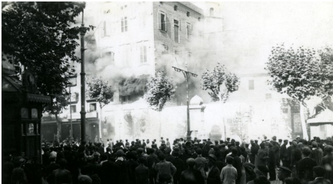
L'incendi dels Escolapis al barri de Sant Antoni de Barcelona

Coromines, que ja havia patit la repressió que va envoltar el Procés de Montjuïc, recorda en els seus diaris: «No tinc de penedir-me de res. No he fet cap acte del qual m'hagi d'avergonyar. Algun diari ha parlat de que volien agafar-me, un periodista m'ha dit que estava a la llista dels deportats». En una carta dirigida a Amadeu Vives, Coromines li resumeix les jornades dient que «el dilluns es va començar per una protesta contra la guerra, cridant 'viva els soldats'. Però la nit mateixa es va girar la cosa cap a la crema de convents" i "el poble, quasi per unanimitat, va trobar bé la protesta el primer dia. Després, la crema dels edificis religiosos va separar de la protesta els carlins i els conservadors». «No creguis lo que diuen de robos, violacions i assassinats dels revolucionaris. Als maristes de Sant Martí els van atacar perquè tiraven. A tot arreu les persones han sigut respectades, i fins tractades amb consideració. Els robos els han fet els granujas i el veïnat, però no els revolucionaris. Les violències són històries per adormir-s'hi dret. En canvi la repressió ha sigut horrible».