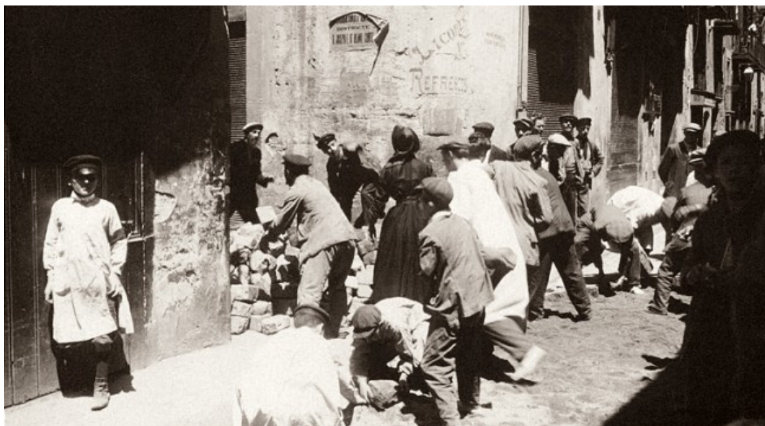
Dones, homes i nens van participar en la construcció de barricades durant la Setmana Tràgica a Barcelona

El darrer dia de revolta, que no de revolució, Pere Coromines explica que algunes de les històries que la gent conta i que ell ha presenciats són pures invencions perquè ell sap la veritat, pel que no s'acaba de creure molts dels relats que la gent li fa de coses que no pot constatar. Coromines conclou que «tots aquests dies m'he pogut fer una idea de com la por i la vanaglòria activen la invenció de l'home. Un urbano em deia l'altra matinada que a la Rambla els soldats marxaven per sota els balcons apuntant enlaire i jo, que vaig passar-hi al cap de pocs minuts, no hi vaig veure ni un soldat ni un guàrdia civil. (...) Es veu que d'aquí a una setmana les llegendes més fantàstiques seran contades amb el mateix aplom que si fossin veritat».