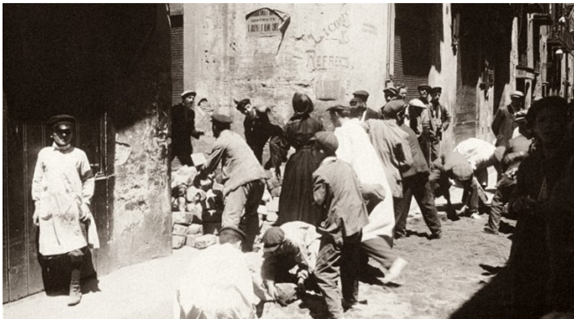
Dones, homes i nens van participar en la construcció de barricades durant la Setmana Tràgica a Barcelona

El darrer dia de revolta, que no de revolució, Pere Coromines explica que algunes de les històries que la gent conta i que ell ha presenciat són pures invencions perquè ell sap la veritat, pel que no s'acaba de creure molts dels relats que la gent li fa de coses que no pot constatar. Coromines conclou que «tots aquests dies m'he pogut fer una idea de com la por i la vanaglòria activen la invenció de l'home. Un urbano em deia l'altra matinada que a la Rambla els soldats marxaven per sota els balcons apuntant enlaire i jo, que vaig passar-hi al cap de pocs minuts, no hi vaig veure ni un soldat ni un guàrdia civil. (...) Es veu que d'aquí a una setmana les llegendes més fantàstiques seran contades amb el mateix aplom que si fossin veritat».