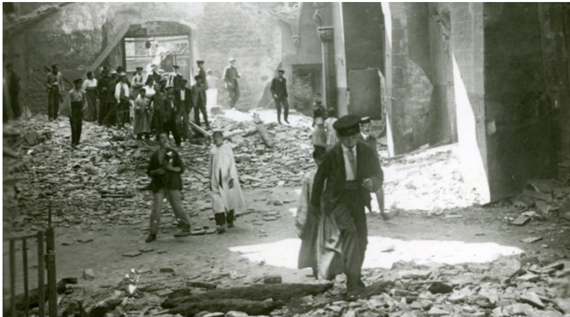
El convent de les Jerònimes després de la crema

S'aixequen barricades, hi ha enfrontaments violents entre els obrers i els militars, sobretot la Guàrdia Civil, i la vaga s'estén a altres localitats com Sabadell, Montblanc, Sant Feliu de Llobregat, Igualada, Alcoi, València, Valls, Palafrugell, Terrassa, Reus, Badalona, Granollers, Vilanova i la Geltrú, Mataró, Sitges, etcètera. Tot i així, és en alguns barris barcelonins com Poble Nou, Sants, Gràcia, les Corts o Drassanes on es produeixen els enfrontaments més violents i continuats. Al migdia, el govern declara l'estat de guerra amb l'oposició del governador civil Ossorio y Gallardo, que presenta la dimissió. Ràpidament, els vaguistes passen a atacar els edificis religiosos, que era on menys resistència podien trobar. Alhora, representaven el poder que volien combatre i que, igual que els demanava submissió, els enviava a morir escorxats a l'Àfrica per uns interessos econòmics d'una elit que tenia vincles de tot tipus amb l'Església.