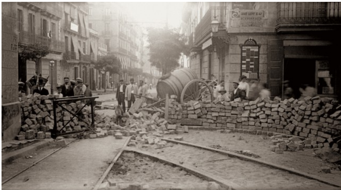
Barricada al barri de Gràcia de Barcelona

El diumenge 25 de juliol, segons explica Josep Benet, va ser un dia de preparatius. Es van transmetre missatges i es van fer reunions amb els delegats obrers arribats d'arreu a la recerca de consignes i notícies. Un dels protagonismes més comentats i discutits, per la seva inexistència, és el que hauria pogut tenir Solidaritat Obrera davant d'un fet que, si bé formalment va començar com a vaga general, no es van desenvolupar com a tal. La Unió Local de Societats Obreres de Barcelona-Solidaritat Obrera s'havia creat el 1907. Aquell any, el 25 de juliol, s'havia publicat un manifest signat per 36 societats obreres i dirigit a tots els treballadors. La constitució formal de La Unió va tenir lloc el 3 d'agost del mateix 1907. Dos mesos després, va començar a publicar un periòdic amb el mateix nom. Un any més tard, el setembre de 1908, es va transformar en Federació Regional de Catalunya. L'organització era sindicalisme pur, organitzada al voltant de demandes immediates i dels convenis col·lectius. En un principi, el sindicat es va declarar lliure de cap ascendència política, i també de marxisme i anarquisme. Ben aviat, però, Solidaritat Obrera va estar sota control anarquista, seguint el model de sindicalisme revolucionari de la CGT francesa. El 13 de juny de 1909, el congrés de la Federació Obrera havia votat unànimement per la tàctica de la vaga general «depenent de les circumstàncies».