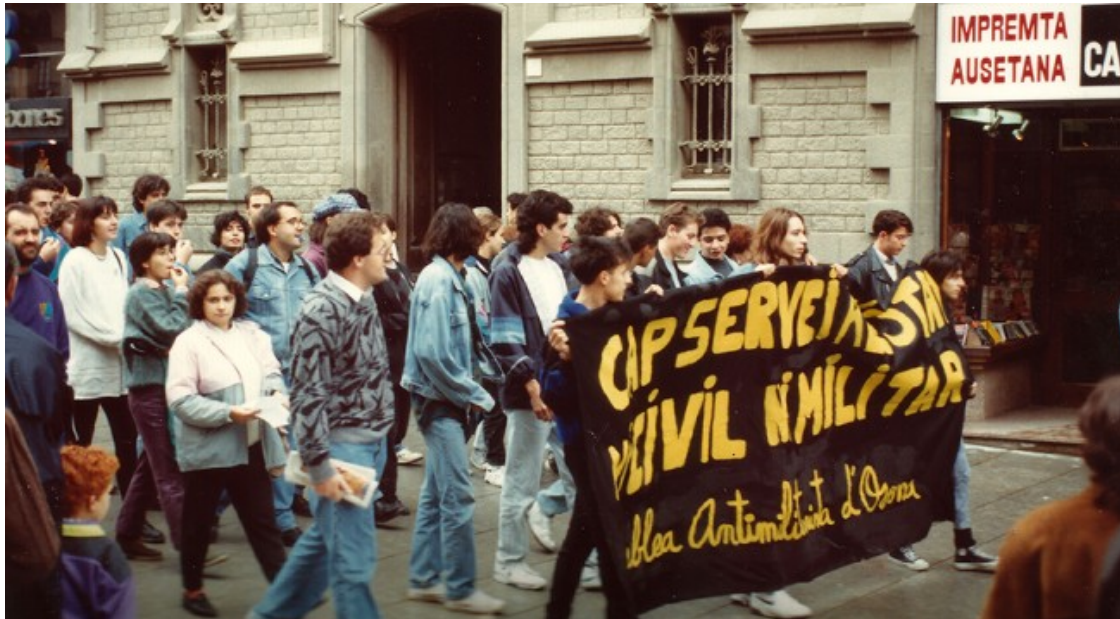
Dos moments més d'una de les manifestacions de l'Assemblea Antimilitarista d'Osona a Vic