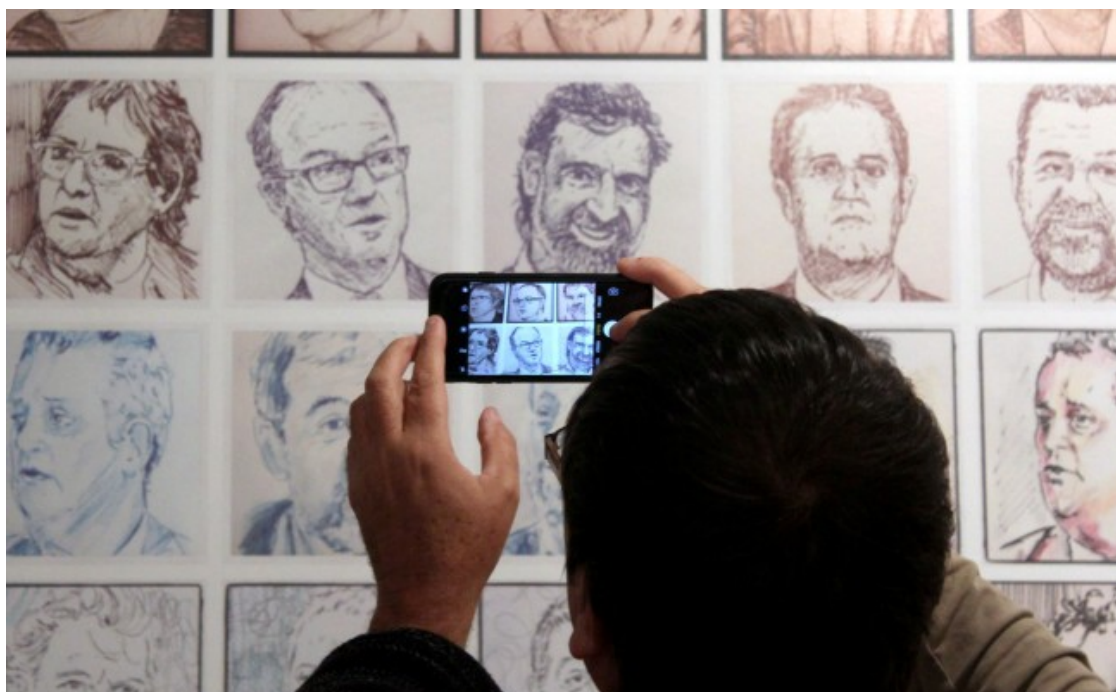
Un visitant de l'exposició fotografia l'obra de Quim Moya durant la inauguració, aquest dissabte

Quim Moya (Barcelona, 1975) és un artista visual i avantguardista que explora les possibilitats de les arts i la pintura i que va estudiar en diferents escoles catalanes d'art, amb especialitzacions en comunicació gràfica, disseny i multimèdia. És un dels cofundadors al 2006 de la Cía. Cándida amb la qual oferien espectacles de pintura en directe que des de 2012 realitza en solitari i que ha portat a ciutats de l'Estat espanyol i països com França, Alemanya, Portugal, Suïssa, el Marroc, Kuwait, Índia, Qatar, Tailàndia, Sudàfrica, Estats Units, etc. A l'actualitat codirigeix el centre de producció cultural i residència d'artistes Cal Gras, situat a Avinyó, al Bages.