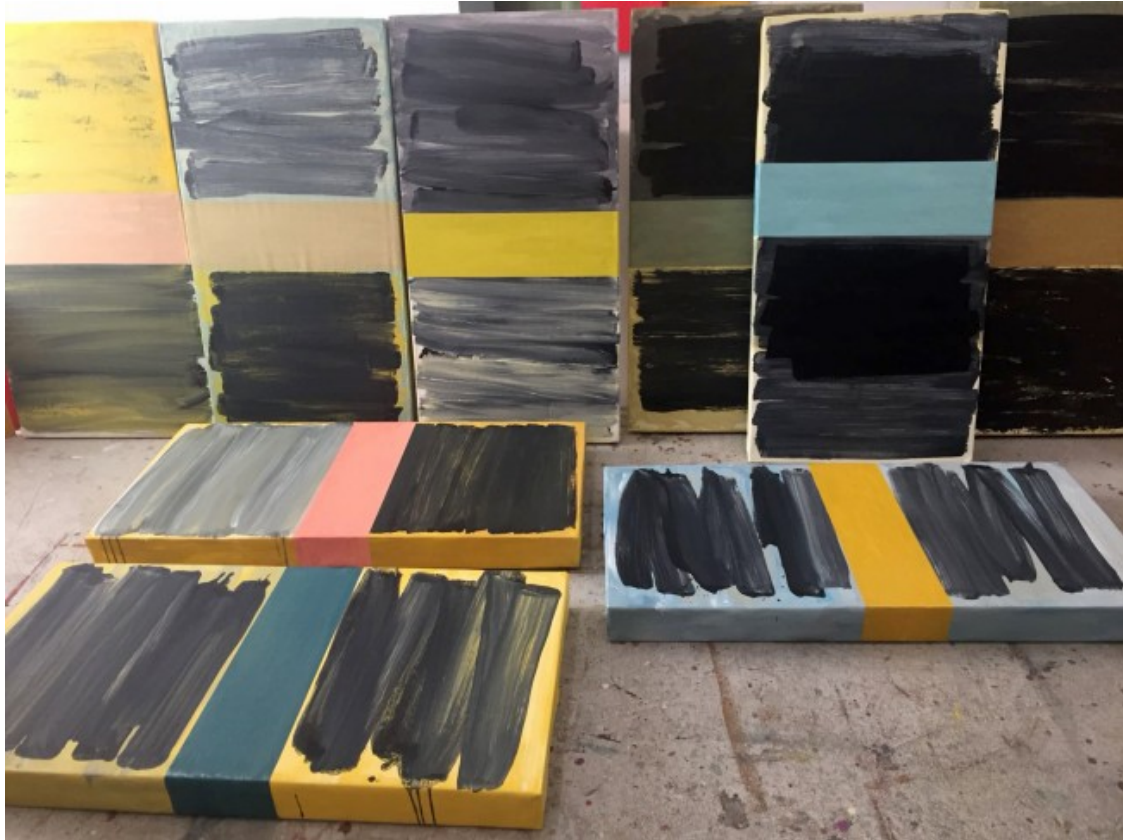
Algunes de les obres de l'exposició «Des del Groc» de Marià Dinarès

Marià Dinarès (Vic, 1959) és un artista visual que en la seva trajectòria ha combinat la pràctica artística i la docència, sobretot a l'Escola d'Art i Superior de Disseny de Vic, i que compagina amb l'impuls i la gestió de l'art contemporani. La seva obra parteix de la pintura, i més concretament d'una part d'aquesta com és el color i l'espai. També ha fet incursions en l'espai escènic i en el terreny de l'art sonor i performatiu. Ha mostrat la seva obra en diferents exposicions i participat en diversos esdeveniments artístics tant a Catalunya com a fora.