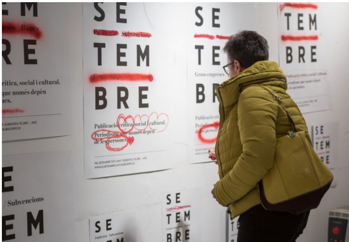
Les persones que van assistir a la festa van poder participar en l'elaboració dels cartells de la nova campanya de Setembre

La festa també va servir per donar el tret de sortida a la campanya de guerrilla que Setembre ha fet amb l'estudi creatiu Partee, que van habilitar la sala d'exposicions de l'Espai ETC per recordar que Setembre no depèn ni de grans empreses, ni de bancs, ni de subvencions, ni de publicitats. Que només depèn de les persones que li donen suport. El públic va poder participar a la campanya pintant els cartells amb diversos materials vermells: pintura, esprai, retoladors, pintallavis, ceres, pintaungles, etc, després de veure el vídeo d'arrencada de la campanya fet per Natx.tv. La campanya continuarà en tots els actes en els quals participi Setembre i també es repetirà als carrers de Vic durant la Diada de Sant Jordi. Des de Setembre es convida a participar-hi i a compartir-ho a les xarxes amb el hashtag #JoSetembre.