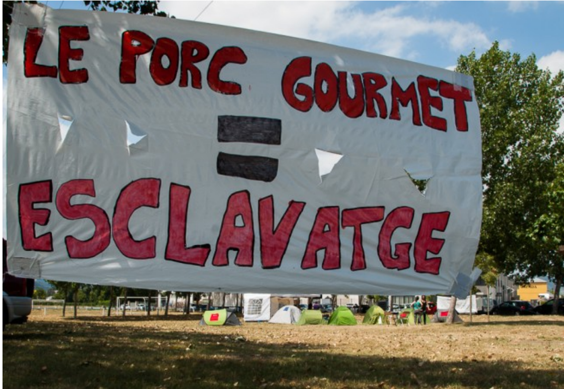
Acampada a Le Porc Gourmet a Santa Eugènia de Berga

producció. En concret, un a la zona de degollament, dos a la d'extracció de budells, i un a la bàscula. Punts claus, segons els responsables de Le Porc Gourmet, en la cadena de producció i que, sense la participació dels quatre denunciants, va haver d'estar aturada fins a cinc hores. I els 1.903 porcs amb els quals no es va poder completar la cadena es van haver de llençar, segons consta també en la documentació aportada per l'empresa al jutjat.