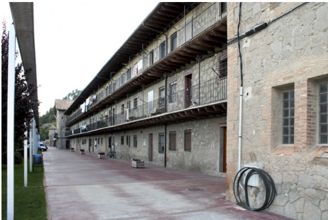
Imatge actual de la colònia industrial berguedana, assaltada per un escamot llibertari fa 69 anys. La colònia de la Plana va ser una de les més importants del Berguedà