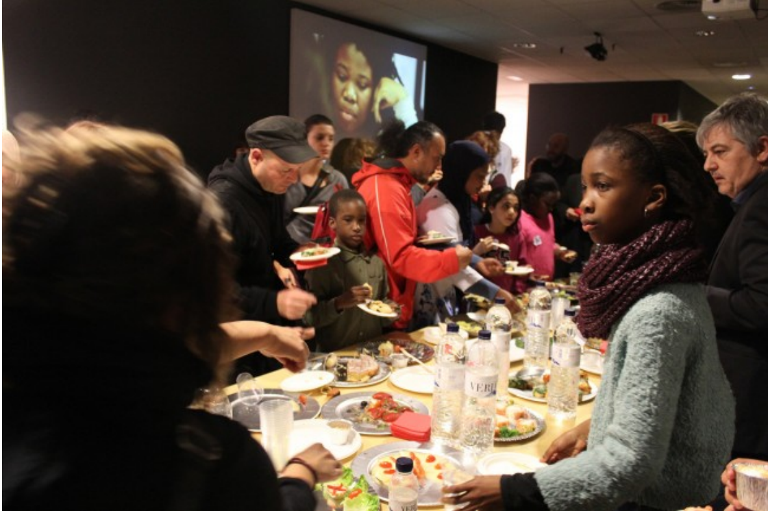
Un moment de la inauguració de l'exposició

enriquir elements identitaris i culturals; potenciar el treball en equip i les relacions interpersonals; elaborar un projecte artístic entre diverses persones que formen part de comunitats locals; i generar treballs interdisciplinaris entre artistes locals i estrangers.