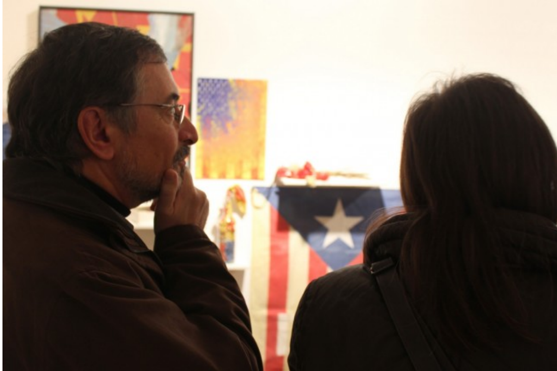
La proposta Tela per fer, inclosa dins l'exposició, exhibeix peces artístiques fetes a partir d'estelades desgastades

interpreten el coneixement del fets que es comuniquen.