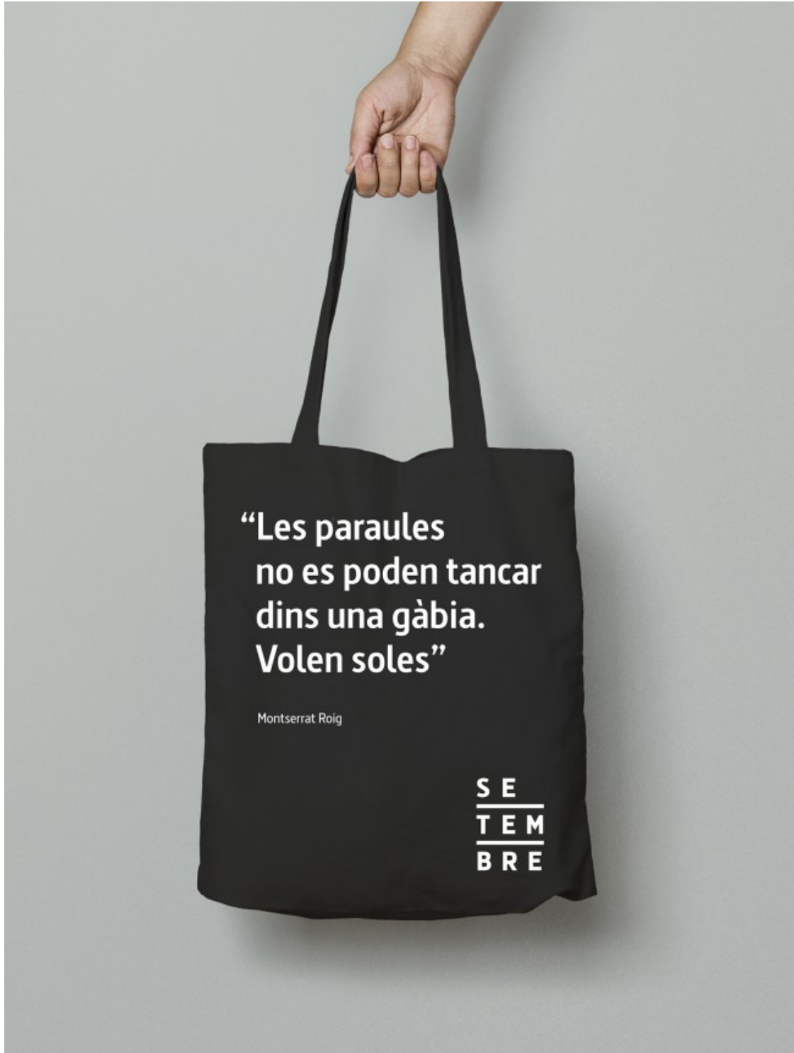
La bossa de Setembre amb missatge de la Montserrat Roig

energies renovables, i amb processos de fabricació que redueixen un 90% l'ús d'aigua i un 95% les emissions de CO2 (certificat per The Carbon Trust).