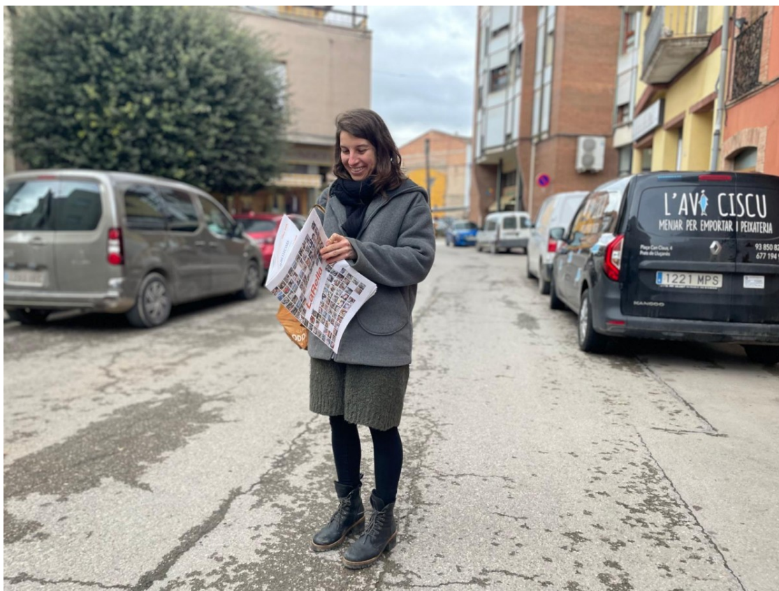
Una lectora llegint el número especial dels 25 anys de La Rella

Es farà aquest dissabte, amb una taula rodona d'entitats, brindis, concurs, sopar i concert amb Blú, DJ Gin, DJ Kaktus i DJ Pontmetralla | Amb motiu de l'aniversari també s'ha editat un número especial de la revista, referent en la informació al Lluçanès