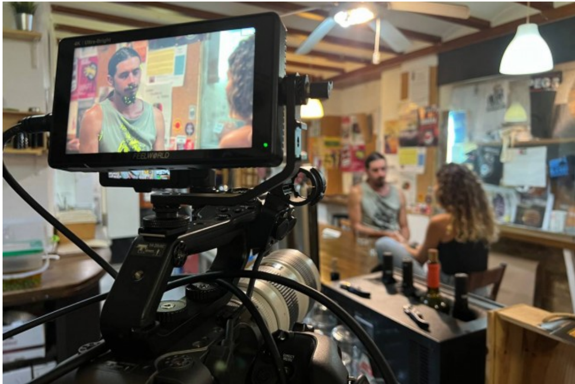
Una part del reportatge s'ha enregistrat al barri de Benimaclet de València