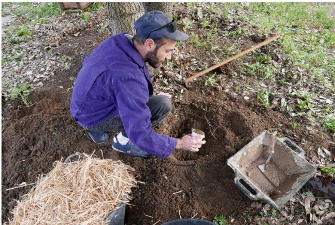
Imatge del taller pràctic de la cinquena sessió de l'Escola del Col·lapse

L'Escola del Col·lapse s'organitza amb la idea de generar debats entorn a diferents temes «col·lapsats», en els quals es compta amb la veu de persones expertes de l'àmbit acadèmic així com actors referents al territori. A la tarda, l'espai es dedica a fer tallers pràctics entorn de cada temàtica.