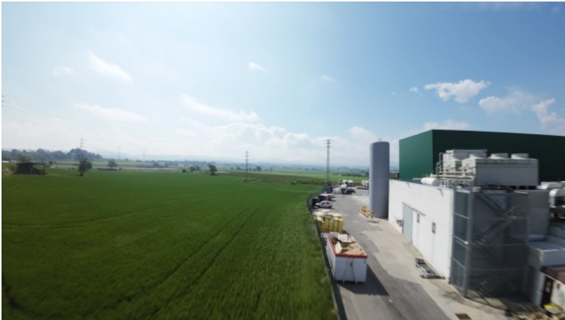
Punt on començaria la construcció del nou macropolígon, paret per part amb la illa càrnia del polígon Malloles