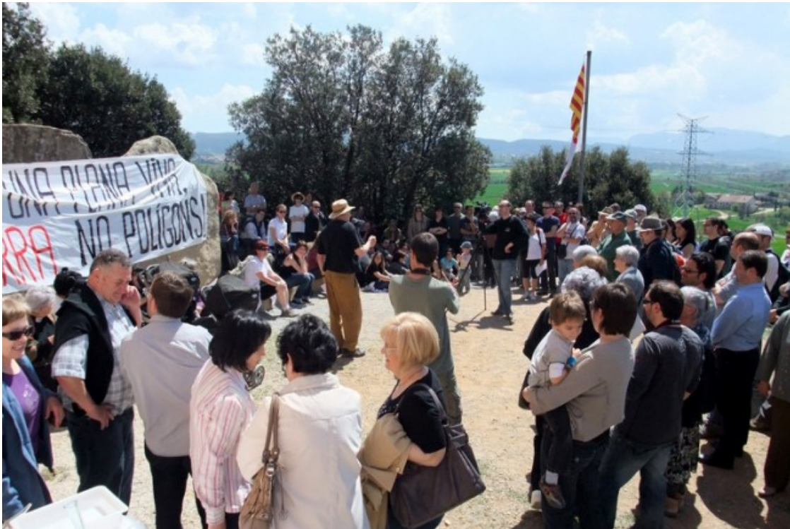
Acció final a l'ermita de Sant Jordi de la caminada reivindicativa del 25 d'abril de 2010