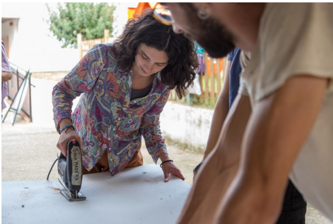
Un moment de la quarta sessió de l'Escola del Col·lapse

L'Escola del Col·lapse s'organitza amb la idea de generar debats entorn a diferents temes «col·lapsats», en els quals es compta amb la veu de persones expertes de l'àmbit acadèmic així com actors referents al territori. A la tarda, l'espai es dedica a fer tallers pràctics entorn de cada temàtica.