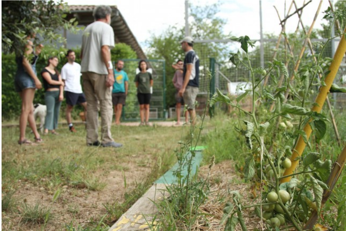
Un moment de la tercera sessió de l'Escola del Col·lapse, dedicada a l'alimentació

L'Escola del Col·lapse, la de diumenge es farà a l'espai El Refugi, al carrer Pau Vila de la Guixa. L'entrada és gratuïta, tot i que es demana que es faci inscripció prèvia al web d'El Refugi. Per si algú vol fer el trajecte fins a la Guixa amb bicicleta, a 2/4 d'11 sortirà un servei de bicibus col·lectiu del davant de l'Espai El Pont del barri del Remei de Vic, a la rambla Josep Tarradellas.