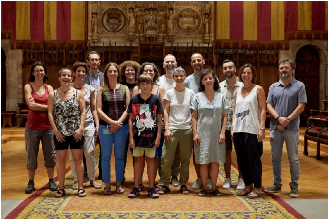
Grup de futures veïnes de l'edifici Abril el dia de la firma de la cessió d'ús a l'Ajuntament