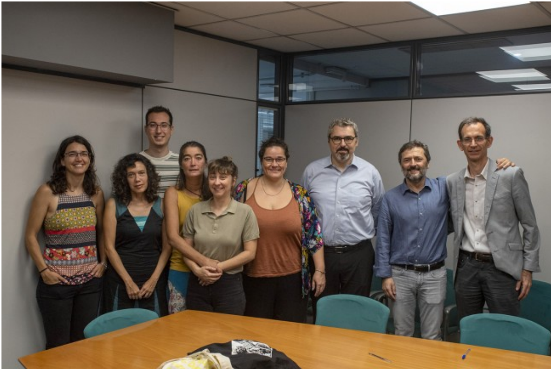
Grup de persones del futur habitatge cooperatiu Empriu el dia que es va firmar el dret de superfície

La cooperativa d'habitatges d'Empriu neix al barri de la Bordeta el 2021 i parteix del compromís de fer assequible el model de cooperativisme d'habitatge, la creació d'habitatge digne i popular, i de caràcter antiespeculatiu. Empriu serà la tercera cooperativa d'habitatges de Can Batlló sumant-se a La Borda i Sotrac. Aposten per encabir el màxim nombre d'habitatges a l'edifici (40) i proveir d'habitatge al màxim nombre possible de persones. D'aquesta forma aconseguen tenir una aportació inicial i quota mensual assequible, esdevenint un projecte divers, inclusiu i social. A més a més, dos dels habitatges estaran destinats per a col·lectius en risc d'exclusió social.