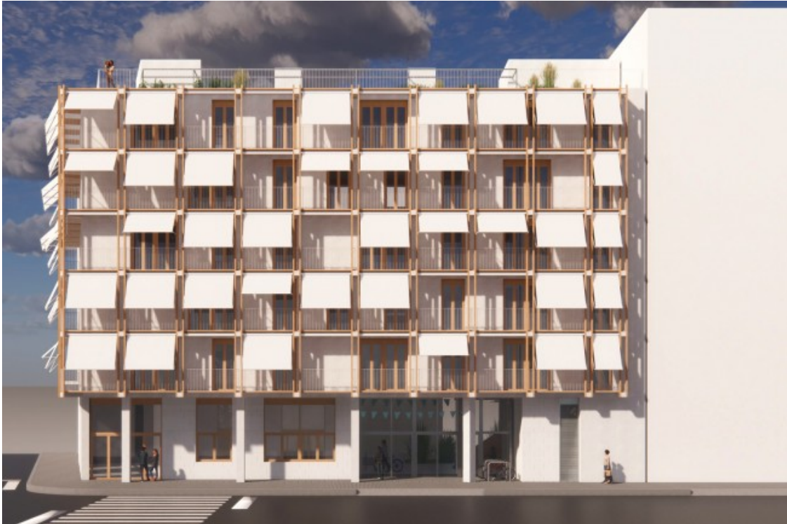
Recreació de com serà el futur edifici d'habitatge cooperatiu Abril

Tots tres edificis han estat dissenyats de forma participada per les sòcies d'Abril, Sotrac i Empriu decidint els espais comunitaris i el grau de convivència de cada projecte. Els arquitectes de Lacol han plasmat les decisions de les usuàries en el disseny arquitectònic dels edificis. Els espais comunitaris més comuns triats per les sòcies són la cuina-menjador, la sala polivalent, la bugaderia i la sala d'usos múltiples, que han de permetre una vida més col·lectiva.