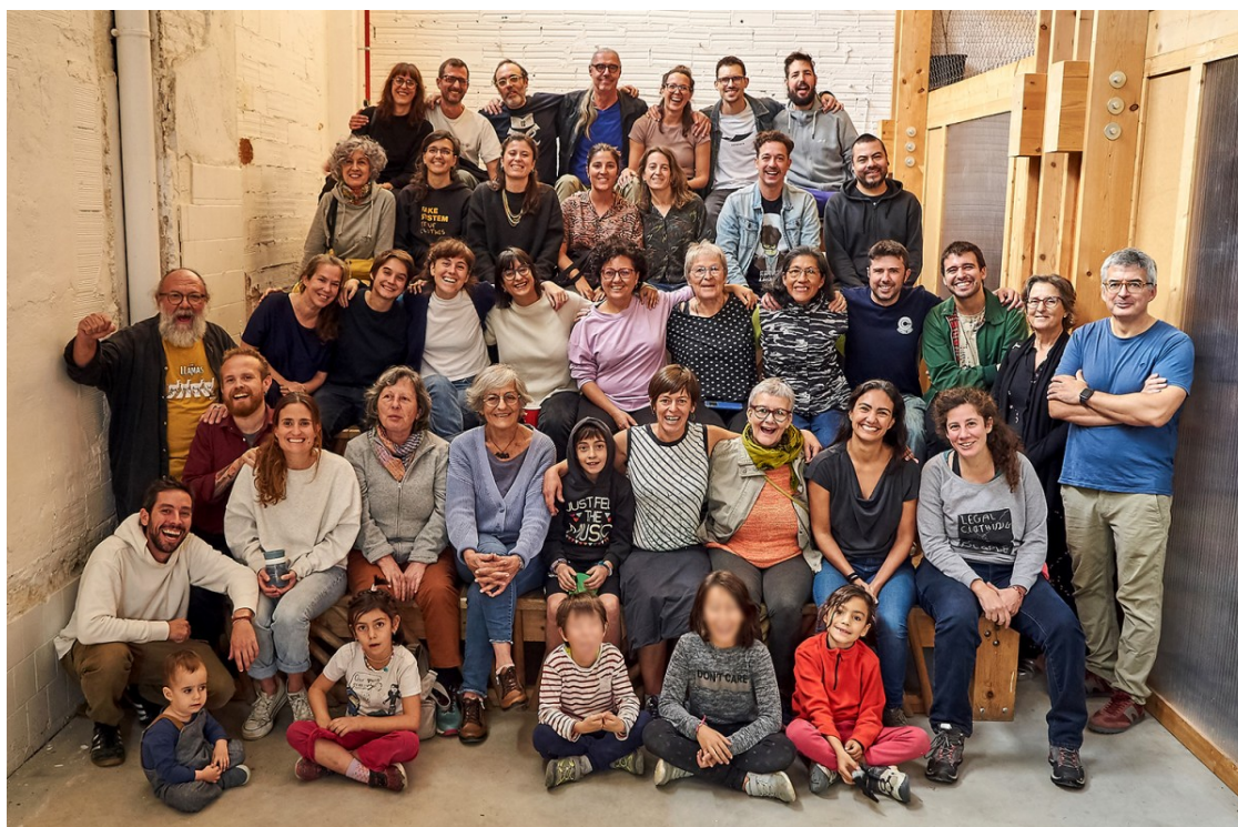
Foto de grup de les futures veïnes de l'edifici d'habitatge cooperatiu Sotrac

El 6 i 7 de setembre se celebrarà l'inici d'obres conjunt de tres noves promocions d'habitatge cooperatiu a Barcelona | Tots tres edificis han estat dissenyats de forma participada per les sòcies d'Abril, Sotrac i Emprui decidint els espais comunitaris i el grau de convivència de cada projecte