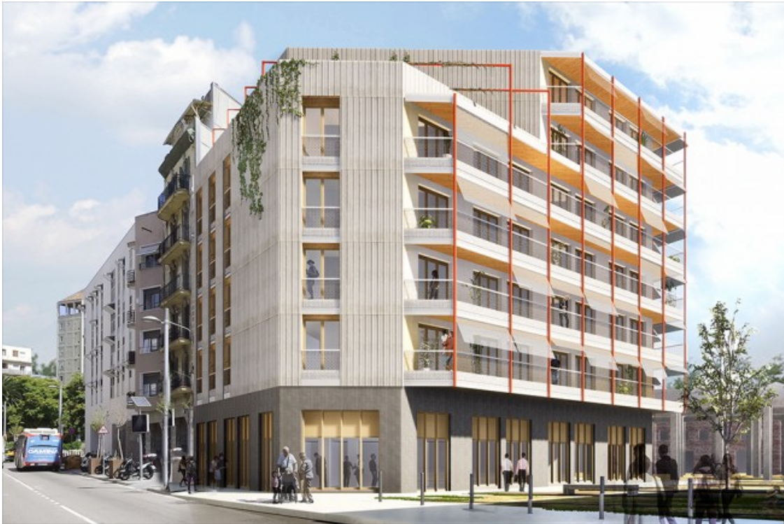
Recreació de com serà el futur edifici d'habitatge cooperatiu Sotrac

Entre totes tres promocions faran possible 96 nous habitatges qualificats de Protecció Oficial en règim de cessió d'ús. La quota mensual que pagaran les sòcies habitants és un 40% inferior a la del preu mitjà del lloguer de mercat als seus respectius barris. En contraposició amb el mercat del lloguer a la ciutat (més del 50% dels lloguers que s'ofereixen són de temporada), els contractes de les cooperatives d'habitatges són estables i de durada indefinida.