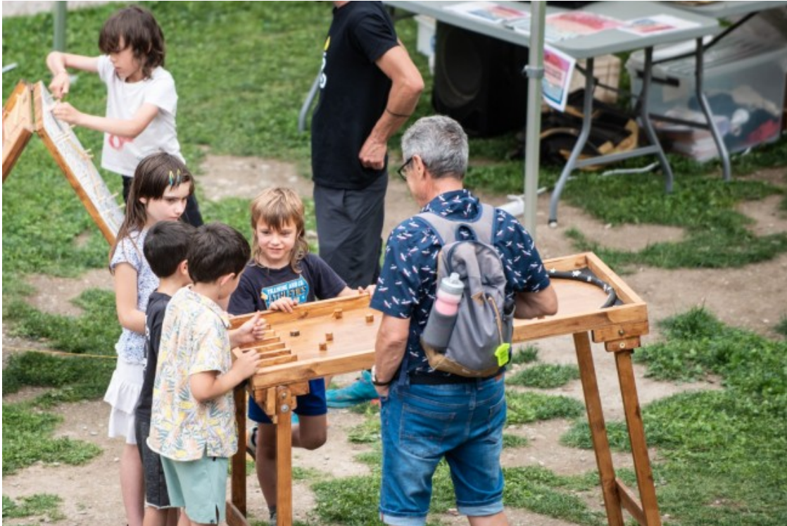
Una de les activitats del FESSrural 2023