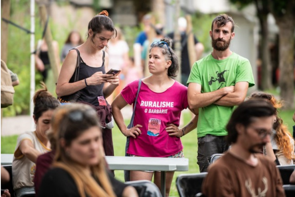
El FESSrural 2023, que va fer-se a Sort