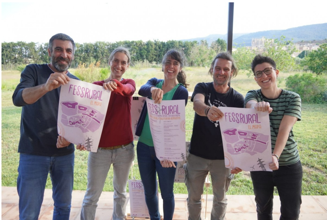
Representants de l'organització després de la presentació del FESSrural 2024

El Festival Rural de l'Economia Social i Solidària servirà per mostrar i enxarxar les economies transformadores del món rural en la lluita contra els macroprojectes | Es farà el dissabte 13 de juliol a Vallfogona de Riucorb, a la Conca de Barberà