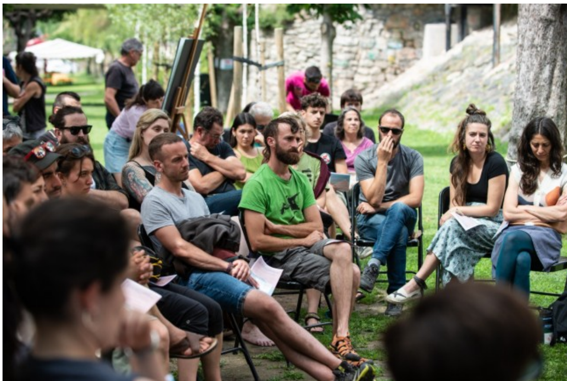
Un moment del FESSrural 2023