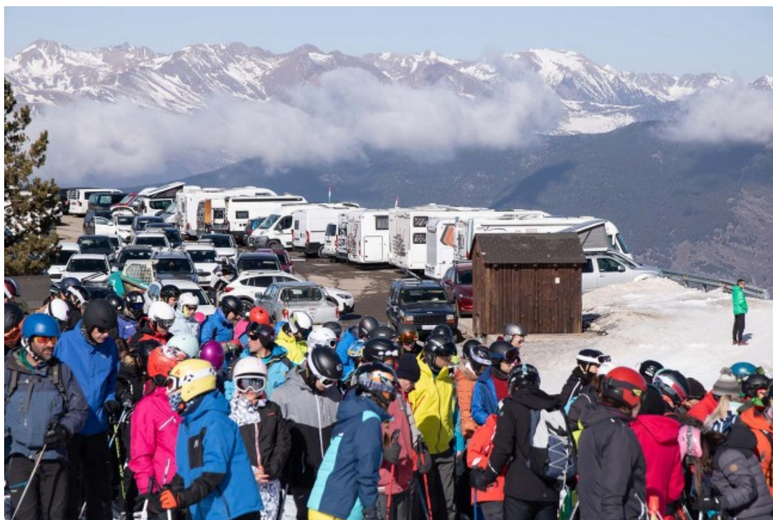
L'actual model turístic comporta una massificació de les pistes d'esquí durant la temporada d'hivern.

Cal tenir en compte que el fet de ser jove afegeix dificultats en aquesta matèria i que moltes persones que arriben al Pallars per estudiar cicles formatius relacionats amb els esports de muntanya han d'esquivar nombrosos obstacles per trobar un habitatge. «Ens ha tocat viure amb gent molt poc respectuosa que abusa del teu espai, agrairies poder triar, això està vinculat amb la situació laboral de la comarca», prossegueix explicant la Lu, que des que viu al territori ha tingut moltes feines i reconeix que s'ha hagut d'aferrar al que sortia i «aguantar treballs en els quals no estava gens a gust».