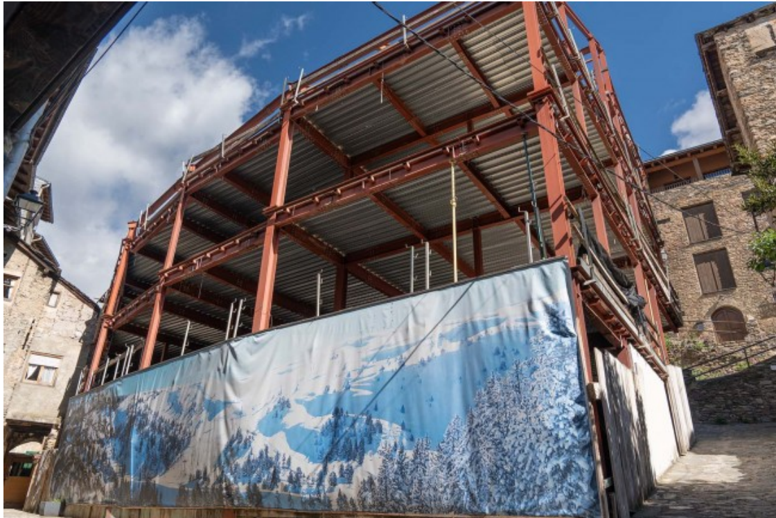
La paradoxa del model territorial

que està destinat a persones en situació de solitud no desitjada que poden patir exclusió residencial.