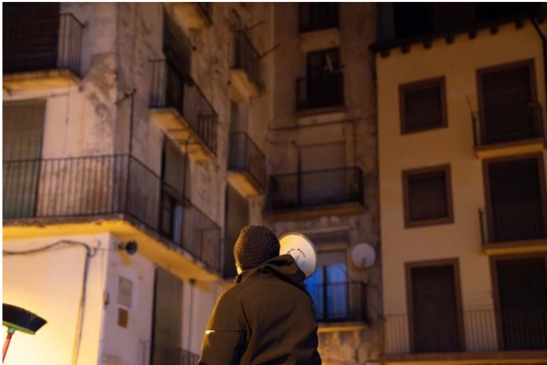
El dissabte 9 de febrer es va celebrar el Carnestoltes Precari a Sort, una rua reivindicativa on les assistents anaven vestides d'escuraxemeneies

cada 100 habitants. A Alp, a la Cerdanya, trobem 298 pisos turístics, que equivalen a 17,4 per cada 100 habitants. Aquest digital també advertia que el lloguer al Pallars Sobirà ha augmentat un 12,2% en un any, segons dades obtingudes a partir de les fiances de lloguer dipositades a l'Incasòl i que fan referència al tercer trimestre de 2023. Però la Val d'Aran té el rècord, ja que allà el lloguer s'ha disparat un 34,4% en l'últim any. També destaquen l'encariment dels arrendaments a la Cerdanya (+17,8%) i l'Alt Urgell (+12,2%).