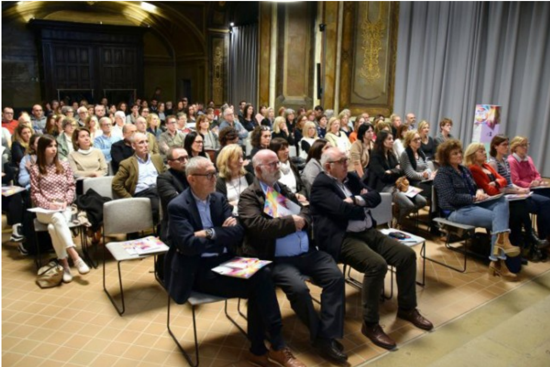
Públic assistent a la sessió de balanç de 2023 que el Consorci va fer al Paranimf de la Universitat de Vic

necessaris per al seu plantejament, ja que es basen en la comptabilitat pressupostària». El CatSalut recorda que un cop aplicat el romanent de tresoreria dels dos exercicis anteriors, «el tancament en comptabilitat pressupostària ha quedat en equilibri».