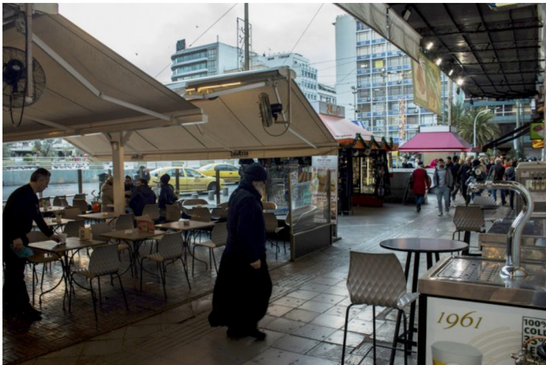
Terrasses a la Plaça d'Omonoia, un dels punts neuràlgics de la ciutat d'Atenes

A Grècia, les problemàtiques s'acumulen i s'engreixen en una dinàmica de cercle viciós. Els darrers anys, amb l'encallament al país de milers de refugiats, la Plaça d'Omonoia també s'ha convertit en un espai de trobada per a molts sol·licitants d'asil. Sense possibilitats d'arribar al nord d'Europa, la gent refugiada és víctima del procés de bunquerització del continent. En la seva ruta de fugida, Grècia només era una parada a mig camí, però el tancament de les fronteres europees va causar que més de 60.000 persones quedessin encallades en condicions deplorables a un país en estat de xoc econòmic. Algunes de les nouvingudes estan en procés de ser relocalitzades a un altre país membre de la UE a través dels programes de reubicació o de reunificació familiar, però són una minoria. Un any després de l'acord entre la Unió Europea i Turquia, la majoria de refugiades s'han de resignar a demanar asil a l'Estat grec si no volen ser expulsades. No obstant, l'acollida no és per a tothom: segons estableixen els criteris de la UE, els refugiats de nacionalitats com Síria o Eritrea són els únics que accedeixen al dret d'asil després de passar per un procediment burocràtic que va a pas de tortuga i funciona malament.