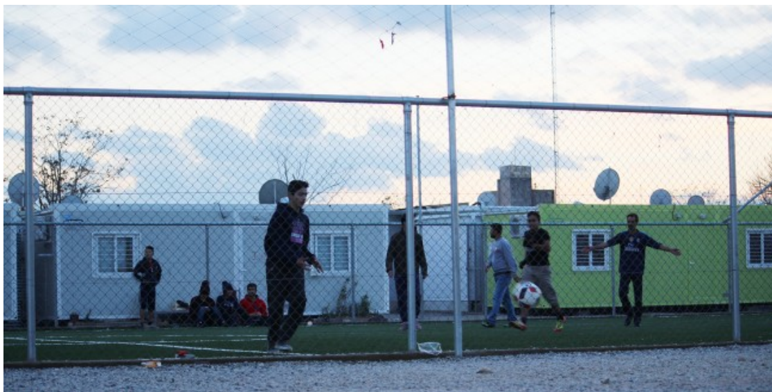
Refugiats joves juguen a futbol al camp d'Elaionas. La gent busca qualsevol activitat per matar el temps

Igual que en Malik, per a moltes refugiades, el procés fins a la resolució definitiva de la seva tramitació d'asil és un camí interminable que està ple d'esculls: la burocràcia grega és caòtica i els tràmits són confusos. En tot el camí, l'angoixa i la incertesa remou per dins a molts sol·licitants d'asil. Elaionas, a prop del centre d'Atenes, és un dels camps de refugiats on els nervis estan a flor de pell. Obert des de l'agost de 2015 per gestionar l'arribada massiva de persones refugiades, al recinte hi viuen 1.500 peticionaris de protecció internacional de més d'una vintena de nacionalitats diferents que estan repartits en files de barracons metàl·lics. Tanmateix, la permanència a Europa de molts dels residents penja d'un fil. «Fins ara, l'Estat grec ha rebutjat la majoria de peticions de refugi de la gent que som de l'Àfrica subsahariana», explica un noi de Costa d'Ivori que prefereix no revelar la seva identitat perquè es troba en una situació legal molt incerta.