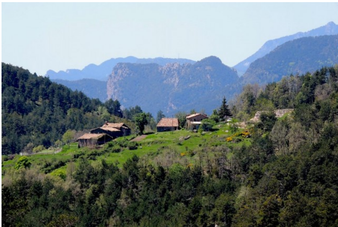
Les masies de Les Lloberes són propietat de Naturalis Science Food

Tot i que l'empresa no ha aclarit a la Directa els plans que projecta a la zona, en l'actualitat és propietària de totes les finques ?excepte una? dins de les àrees privades de caça que ostenta i en té dues més ?Lloberes de Dalt i Terradelles? dins el vedat Les Planes, que pertany a la Societat de Caçadors de Sant Jaume de Frontanyà. Aconseguir la titularitat del vedat Les Planes suposaria la connexió de les tres àrees, que sumen vora 3.572 hectàrees. De fet, a la plataforma No als vedats elitistes li consta que l'empresa, per ara, ja té un contracte amb la societat de caçadors per a la cessió de drets d'aprofitament cinegètic en els terrenys de les dues finques de la seva propietat dins aquest vedat.