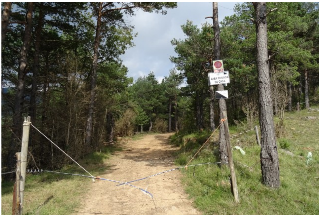
Vedat de Llentes Caselles

Per la seva banda, l'Ajuntament de les Lloses ha assegurat a la Directa que els «inquieta» la compra dels terrenys i que «si es busca fer un vedat privat que promogui un tipus de caça elitista deslligada del territori, el consistori s'hi oposa». El nou equip municipal té com a objectiu potenciar la regeneració de l'entorn rural i agrari i assegura que el suposat projecte de vedat aniria en direcció contrària. També es queixa que fa un mes i mig van demanar a la Generalitat informació sobre els plans de gestió cinegètica de Naturalis Science Food i encara no han rebut resposta. En el moment de publicar l'article, l'Ajuntament de Sant Jaume de Frontanyà encara no havia contestat les preguntes de la Directa.