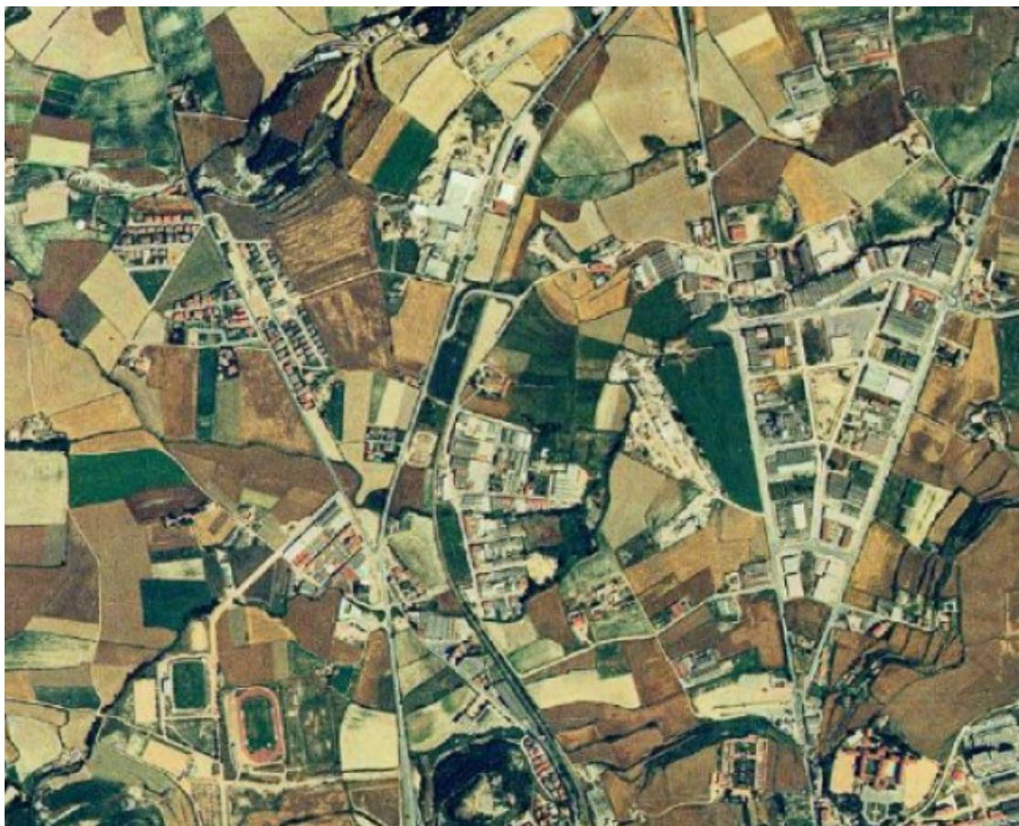
Imatges aèries dels polígons industrials de Vic i Gurb a l'actualitat (a dalt) i el 1993 (a baix), on s'aprecia el creixement urbà dispers que ha tingut lloc els últims anys.

Aquesta és una nova entrega de les set anàlisis incloses en l'article d'autoria col·lectiva «Radiografia: Dades de set àmbits de Vic que et sorprendran», publicat íntegrament a Setembre el dia 11 de maig. L'article és fruit del treball conjunt de diverses persones i entitats que ha donat com a resultat una anàlisi aprofundida sobre com està Vic en els àmbits de la pobresa i la desigualtat, l'habitatge, la segregació en l'educació i la salut del català, la sanitat, la contaminació, la discriminació i el model urbanístic.