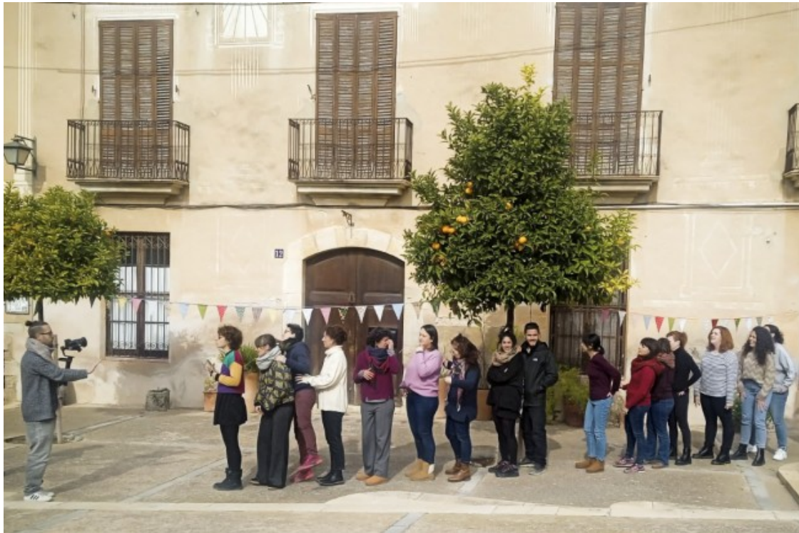
Un moment del rodatge del videoclip, en aquest cas a les comarques tarragonines