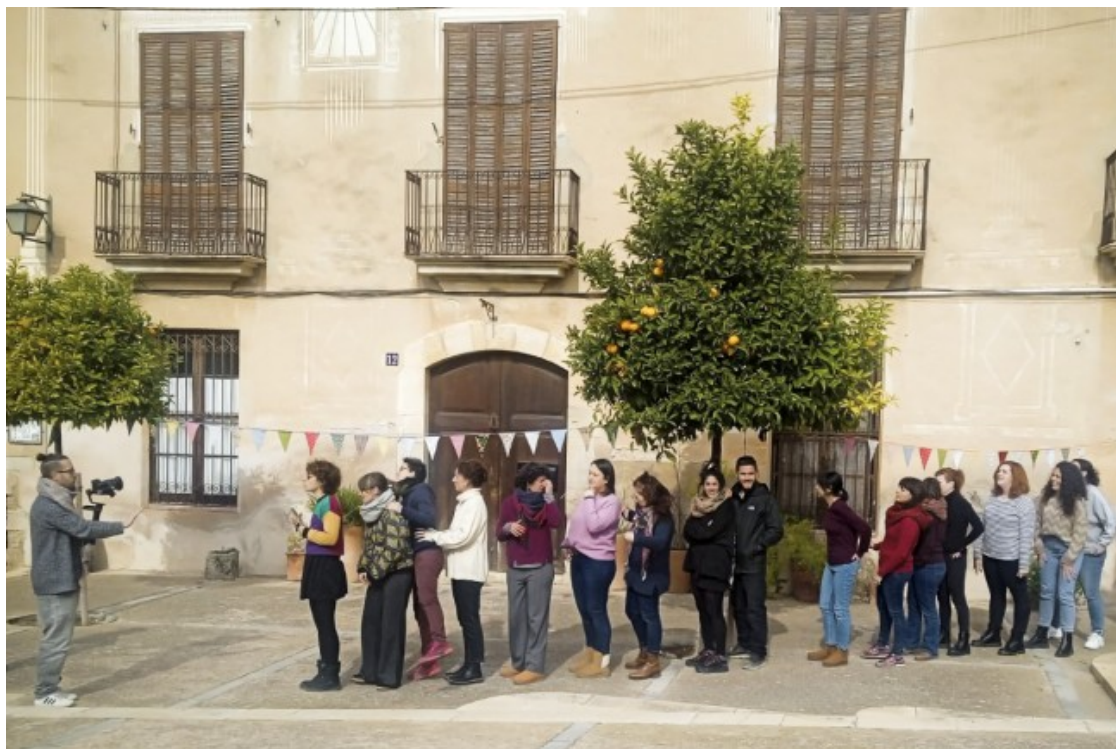
Un moment del rodatge del videoclip, en aquest cas a les comarques tarragonines