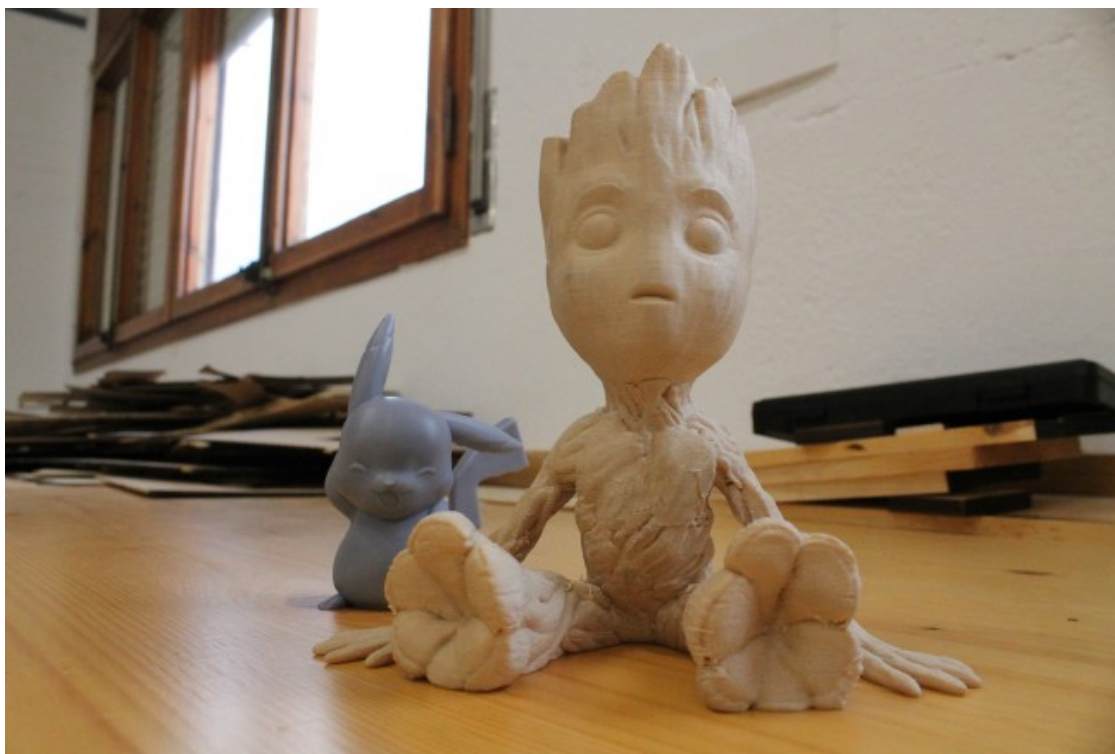
Dues figures creades amb impressores 3D, la de l'esquerra feta amb filament i la de la dreta amb resina

s'utilitza, es poden aconseguir diverses formes i acabats.