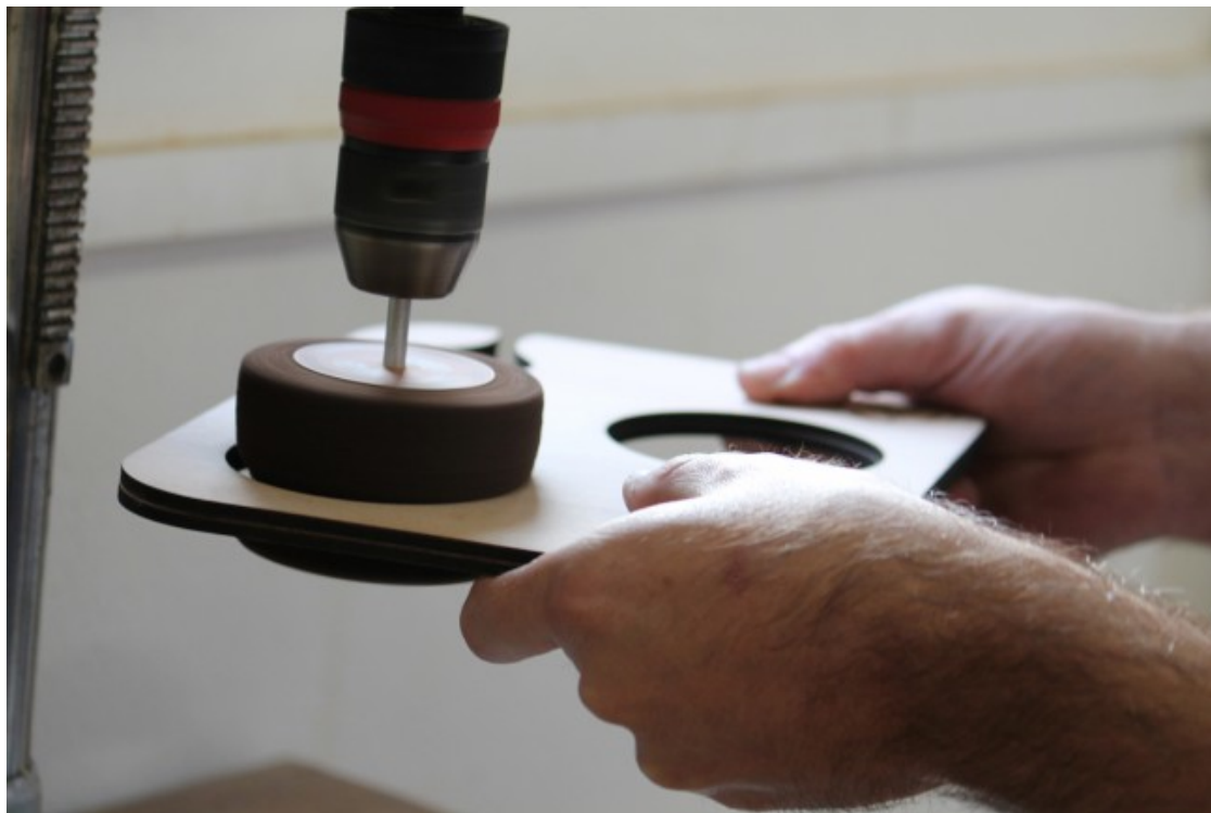
Al Klaab s'hi creen tot tipus de peces de fusta, com aquesta safata per fer tastos

Però què és fablab? Ells ho defineixen de forma clara i senzilla: «És un espai de treball equipat amb màquines de fabricació digital». Anem a pams. I què és la fabricació digital? «La fabricació digital és aquella que ens permet automatitzar el funcionament d'una màquina a partir de processos informàtics, i el fablab vol ser el punt de trobada entre aquesta tecnologia i els tallers tradicionals on sempre s'han fet coses».