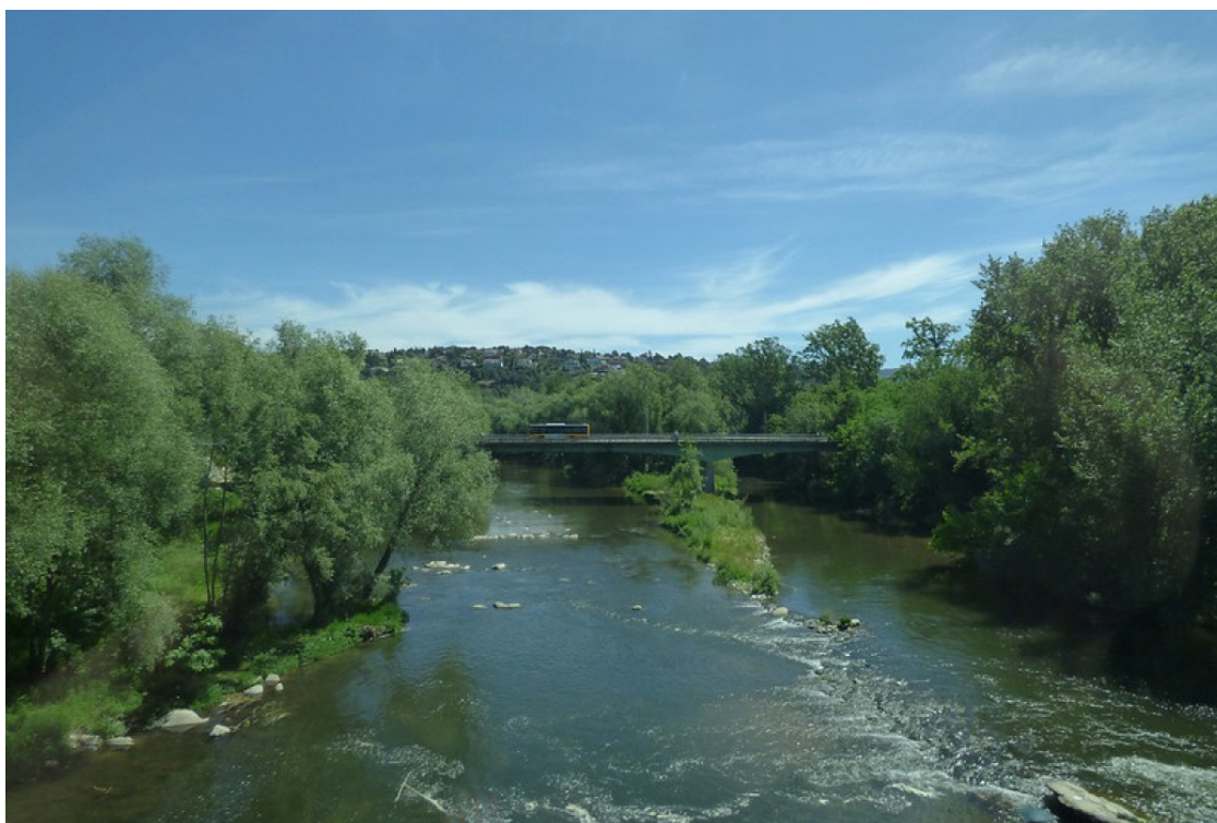
El riu Ter al seu pas per Girona