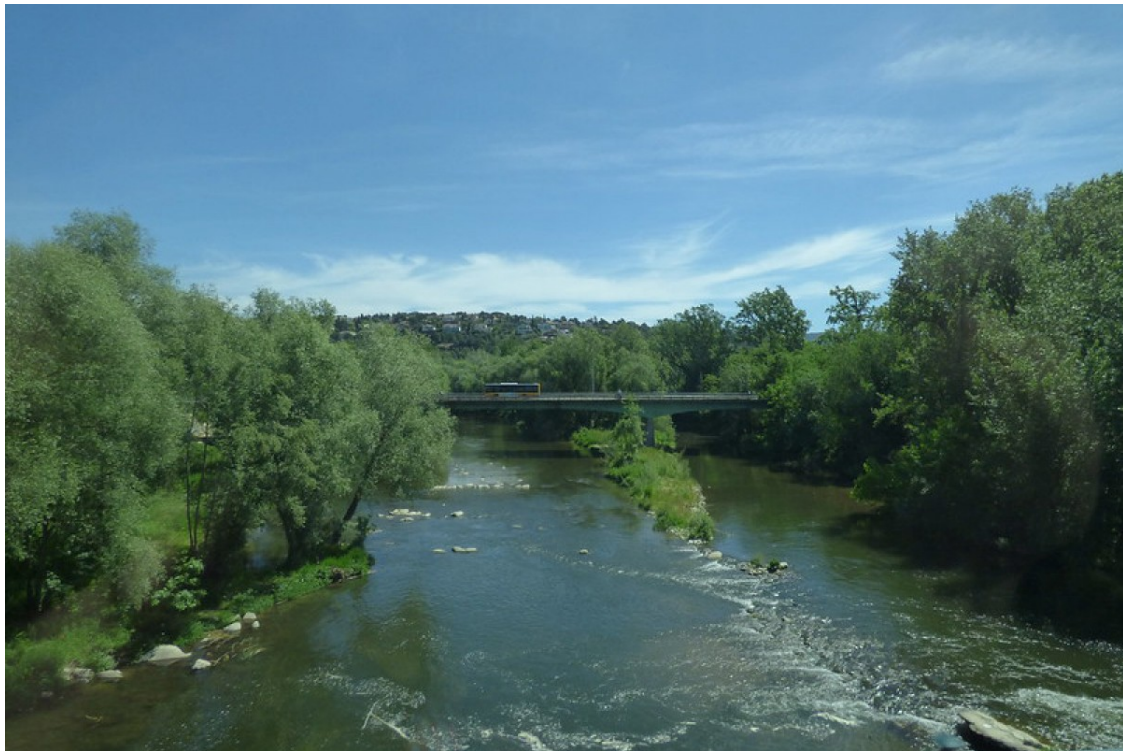
El riu Ter al seu pas per Girona