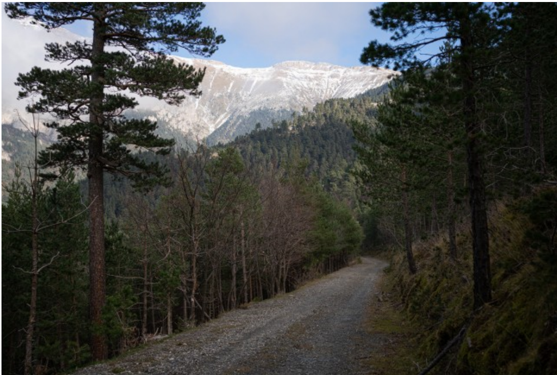
A la zona del Cadí-Moixeró Integra Pirineus està fent una tasca d'aclarida de millora i d'habilitació de la zona per pastures

formació prèvia per fer-ho». La Laura Vivet, coordinadora del CFFE, explica: "Aquesta desvaloració ensorra el sector i no li permet dignificar-se".