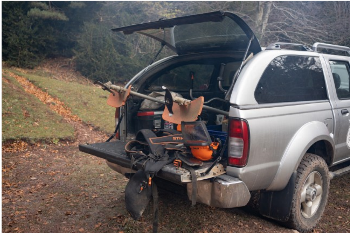
Els treballadors s'organitzen per àrees i tipus de treball segons la seva experiència i la dificultat de cada terreny

més diners, es poden permetre una inversió més gran en la seguretat, van molt més protegits». «Són equipaments poc pràctics, incòmodes i fan calor», argumenten altres treballadors. Tot i això, són eines necessàries de prevenció i de protecció davant dels accidents.