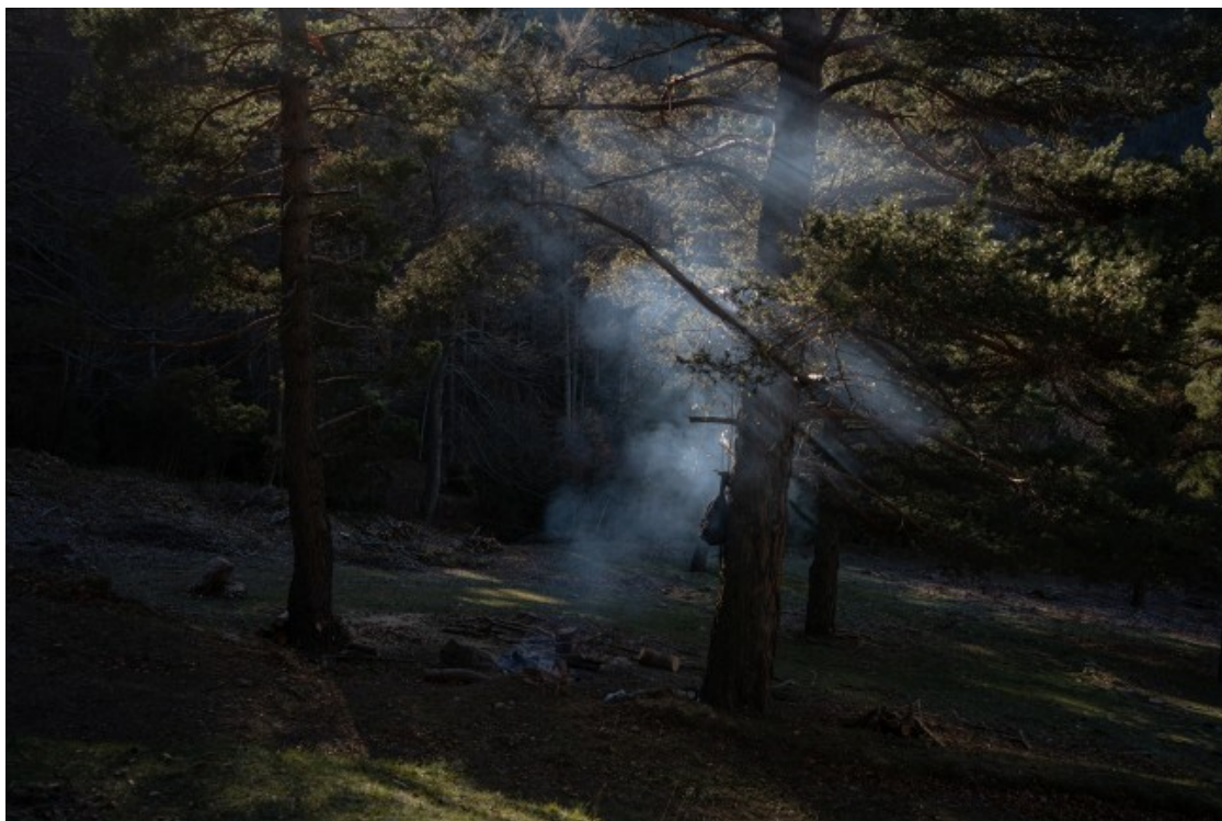
Les condicions climàtiques poden dificultar les condicions de feina dels treballadors

L'augment de les subvencions, la facilitació dels tràmits i el suport institucional també és una reivindicació per fer més accessible el mercat laboral del sector. «Hi ha moltes traves administratives i s'han de demanar molts permisos. El gran problema és que el treballador forestal no s'ha cuidat, sort dels pocs que ens apassiona i hem decidit dedicar-nos-hi igualment», apunta Manolo Bautista. «El discurs polític és buit, l'administració està deixant de ser útil i pràctica per culpa de tota la burocràcia. A més, la investigació que s'està fent és molt exigent tenint en compte la situació del sector, es necessiten polítiques i accions que puguin aterrar i revertir-se al territori», defensa Juan Antonio Arévalo.