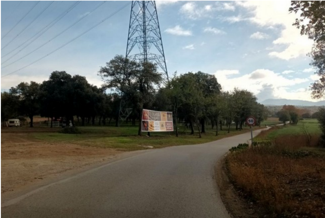
Al fons, cartell de publicitat del macrofestival. La imatge permet fer-se una idea de les dimensions del camí asfalta pel qual es pensa fer arribar més de 2.000 vehicles diaris a l'esdeveniment

I davant la possibilitat que se'ls emmarqui dins l'anomenada «cultura del ?no' a tot», la plataforma complementa el seu comunicat amb un gràfic «NO al Festimarket nadalenc El Caganer», però en canvi, dient ?sí' als esdeveniments dimensionats al territori, a la circulació sostenible, a la preservació dels espais agraris, a les iniciatives sorgides dels habitants del territori, a l'estalvi d'aigua, a l'ús d'energies sostenibles, a la seguretat, a la qualitat de vida dels habitants de la comarca en general i de Folgueroles en particular, a un turisme sostenible i respectuós amb el medi ambient, i a la preservació de paisatges rics en biodiversitat com el que es farà el macrofestival nadalenc.