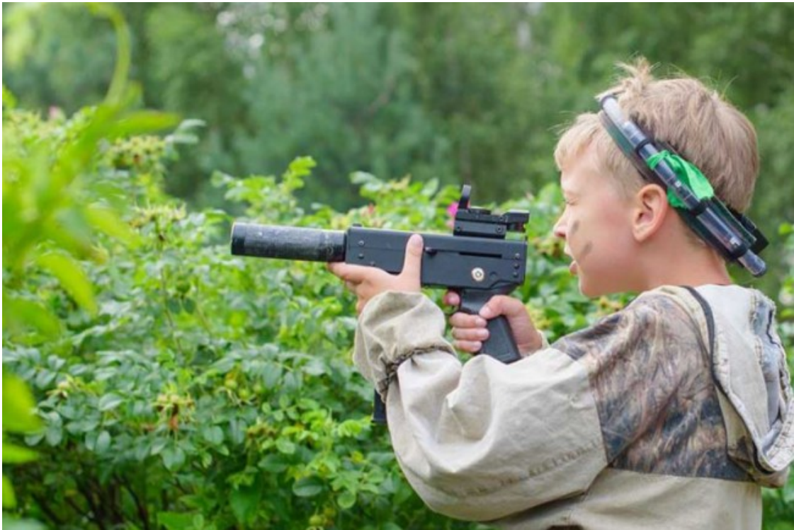
Un nen amb una arma, imatge inclosa en la publicitat del macrofestival, en concret de l'activitat del Làser Tag