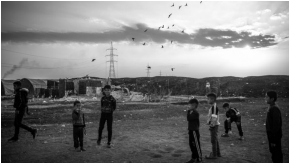
«Erdogan, per què ens fas això? Què hem fet nosaltres? Ser kurds? Tenim fills! Què hem fet nosaltres? Preparar menjar cada dia per intentar viure?.»

En Muhamed, el pare d'algun dels infants, està amb el mòbil buscant informació. En kurd, diu: «Sembla que no és només aquí a Kobane, hi ha altres ciutats que han sigut atacades alhora». I