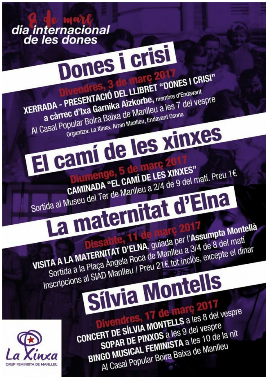
Cartell dels actes de la Xinxa Feminista per aquest 8-M