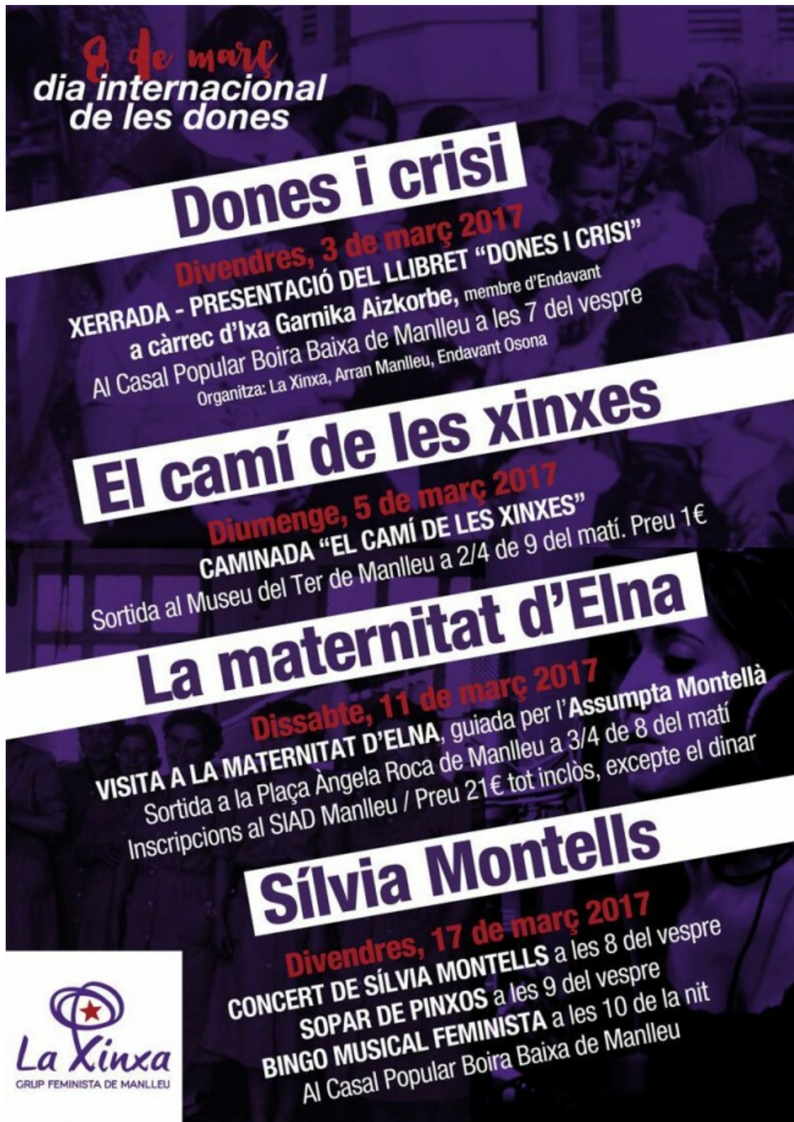
Cartell dels actes de la Xinxà Feminista per aquest 8-M