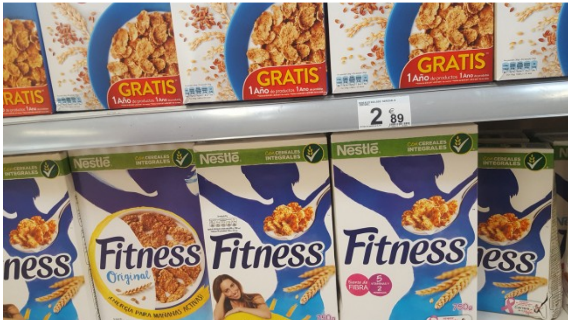
Cereals amb excés de sucres i una publicitat que remet a l'alimentació saludable en un supermercat de Vic

A partir de dades de l'Institut Nacional d'Estadística i del Ministeri d'Agricultura, s'ha analitzat la despesa alimentària en funció de diferents variables socials, amb l'objectiu d'identificar els estrats i tipus socials que estan per sota del cost d'una alimentació saludable. Les llars amb ingressos nets mensuals inferiors a 1.500 euros haurien d'incrementar la seva despesa en alimentació per poder seguir les recomanacions nutricionals. I el 45% de les llars estan per sota d'aquesta xifra. Per tant, gairebé la meitat de la població espanyola no pot seguir les recomanacions nutricionals sense incrementar la seva despesa en alimentació, cosa que no pot fer.