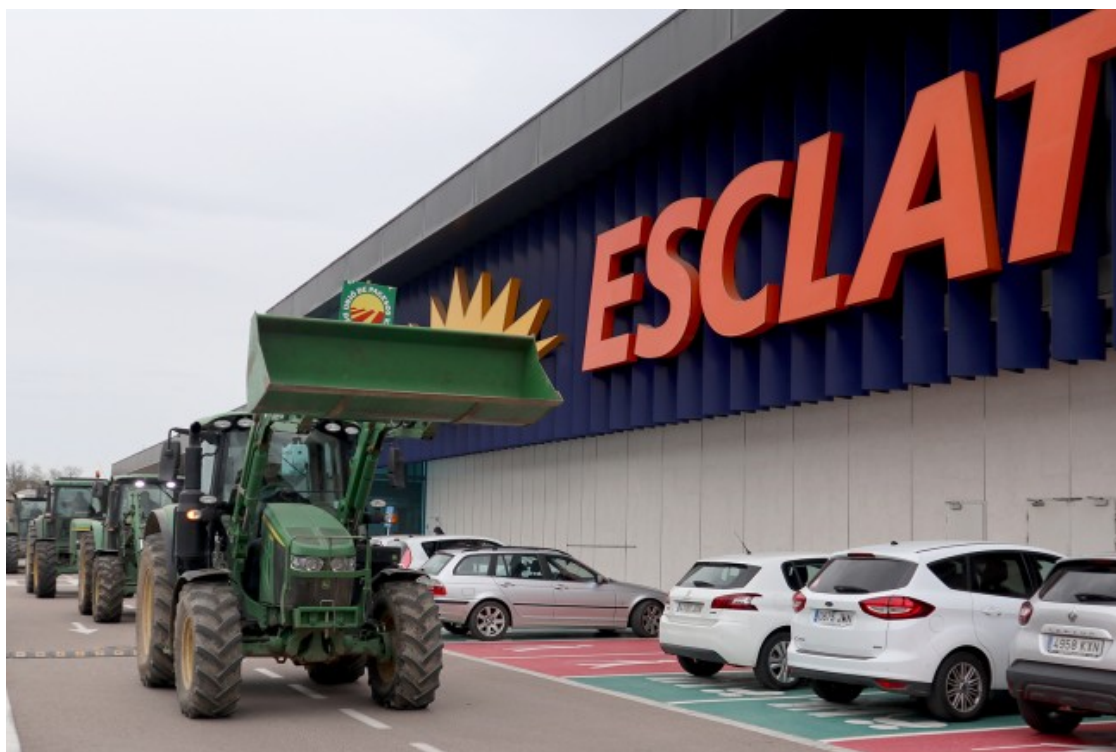
Tractors arribant a l'acció de protesta d'aquest dissabte a les portes de l'Esclat de Malla