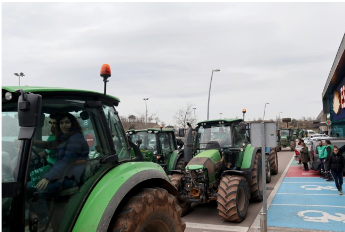
Una trentena de tractors han participat en la protesta d'aquest dissabte a l'Esclat

La llet Terra i Tast, que comercialitza Bon Preu després de pagar-la a un preu una mica més alt a dues cooperatives osonenques, també ha tingut el seu protagonisme. Bàsicament perquè representa una quantitat ínfima de la llet que ven aquesta distribuïdora i perquè des que el febrer es va anunciar el seu llançament, moltíssimes vegades el seu espai en els lineals de Bon Preu i Esclat estan buits. A la mateixa hora que es feia l'acció, tot i sent un dissabte al matí, amb una gran afluència de clients, als lineals de llet de l'Esclat de Malla no hi havia ni un sol bric de Terra i Tast.