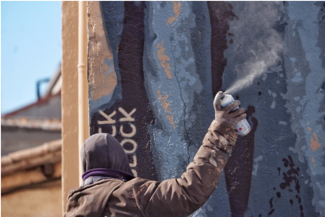
Va crear Murs de bitàcola, un projecte nascut de treballar amb imatges locals vinculades a la realitat dels barris i dels pobles.

Aquest impacte positiu en la gent gran d'una cosa que sovint es relaciona amb el jovent, com és el graffiti o les arts de carrer, el va portar a gravar una veïna de Sant Carles de la Ràpita explicant la fotografia que estava pintant, transcriure-ho i publicar-ho, «a molta gent li va agradar el relat que hi havia darrere la foto». Això el va empènyer a mapejar tots els murals que havia fet sobre memòria per donar una dimensió de conjunt i generar un pont «interessant» entre les xarxes socials i el carrer, «les xarxes socials ens han ajudat molt a projectar-nos, però també impliquen un consum molt ràpid i buit de contingut». Això se suma, segons Roc Blackblock, a «la cultura d'allò retro i allò vintage, que moltes vegades el que fa és folkloritzar els records i quedar-se amb la cosa estètica».