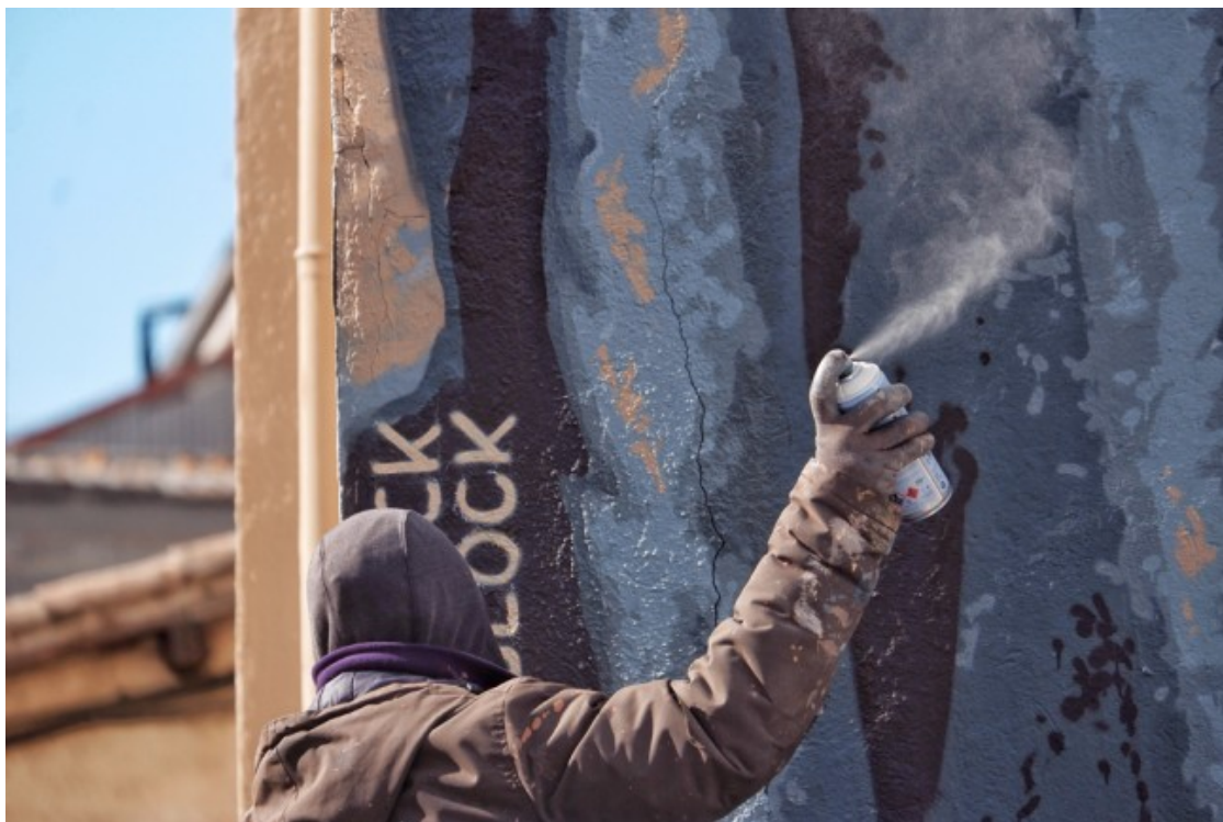
Va crear Murs de bitàcola, un projecte nascut de treballar amb imatges locals vinculades a la realitat dels barris i dels pobles.

Aquest impacte positiu en la gent gran d'una cosa que sovint es relaciona amb el jovent, com és el graffiti o les arts de carrer, el va portar a gravar una veïna de Sant Carles de la Ràpita explicant la fotografia que estava pintant, transcriure-ho i publicar-ho, «a molta gent li va agradar el relat que hi havia darrere la foto». Això el va empènyer a mapejar tots els murals que havia fet sobre memòria per donar una dimensió de conjunt i generar un pont «interessant» entre les xarxes socials i el carrer, «les xarxes socials ens han ajudat molt a projectar-nos, però també impliquen un consum molt ràpid i buit de contingut». Això se suma, segons Roc Blackblock, a «la cultura d'allò retro i allò vintage, que moltes vegades el que fa és folkloritzar els records i quedar-se amb la cosa estètica».