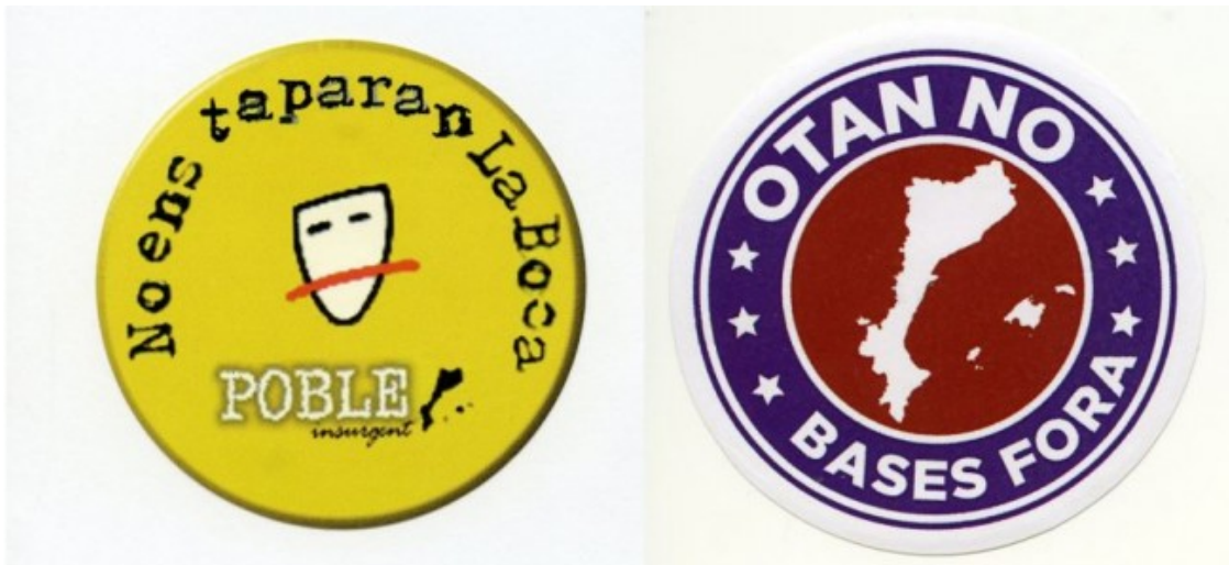
A l'esquerra, adhesiu per la llibertat d'expressió de Poble Insurgent de l'any 2000. A la dreta, un contra l'OTAN i les bases americanes amb motiu del referèndum de l'OTAN de 1986