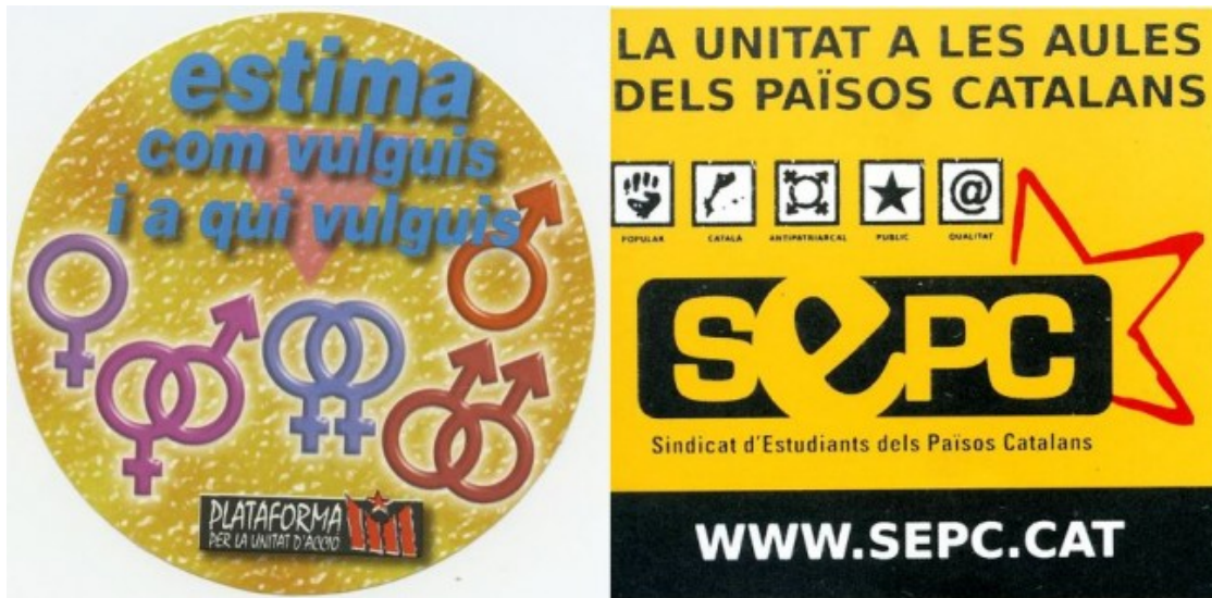
A l'esquerra, adhesiu pels drets LGTBI de la Plataforma d'Unitat d'Acció (PUA) de finals dels noranta. A la dreta, adhesiu del Sindicat d'Estudiants dels Països Catalans (SEPC), de 2006, l'any que va néixer aquesta organització estudiantil fruit de la unió del CEPC i l'Alternativa Estel