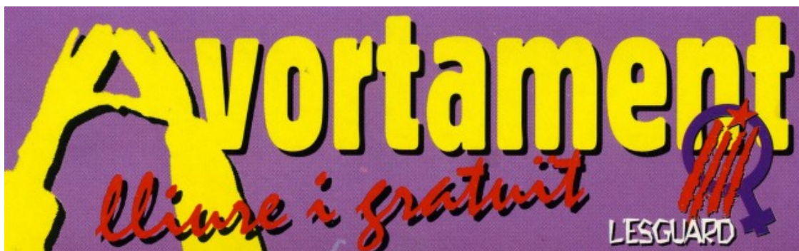
Adhesiu del col·lectiu feminista L'Esguard de mitjans dels anys noranta

Els editors del llibre expliquen en la presentació que «fer la selecció d'adhesius no ha sigut una tasca senzilla», especialment a causa de l'extensa quantitat de material disponible. Segons Pep Garcia, un dels tres autors que firmen l'obra, els adhesius prenen una especial importància en aquells moviments socials i polítics que es mouen al marge d'allò que està establert i que tenen el seu espai d'expressió al carrer. Aquest seria el cas de l'Esquerra Independentista. Dels més de 50 anys d'aquest moviment polític, la participació en les institucions ha estat puntual i molt recent. La gran part de l'activitat s'ha dut a terme des del carrer, en casals i ateneus populars, amb manifestacions o actes de suport a diverses lluites socials, veïnals o d'abast més gran.