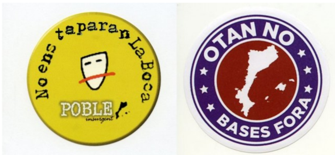
A l'esquerra, adhesiu per la llibertat d'expressió de Poble Insurgent de l'any 2000. A la dreta, un contra l'OTAN i les bases americanes amb motiu del referèndum de l'OTAN de 1986

Difon la idea , però, no és només un llibre d'adhesius contextualitzats en cinc dècades de lluita de l'Esquerra Independentista catalana. També entra en l'anàlisi dels elements gràfics que caracteritzen aquest material de difusió i propaganda i les circumstàncies en què va ser editat. I és que tal com explica el dissenyador Jordi Padró, un altre dels coautors del llibre, «la gràfica de l'Esquerra Independentista és un reflex dels temps que li ha tocat viure, durant anys buscant comunicar per damunt d'aportar una gran qualitat estètica», moltes vegades reutilitzant dissenys previs o procedents d'altres moviments d'arreu del món. «No en va tot el que venia d'Euskal Herria va ser font d'inspiració», reconeix Padró.