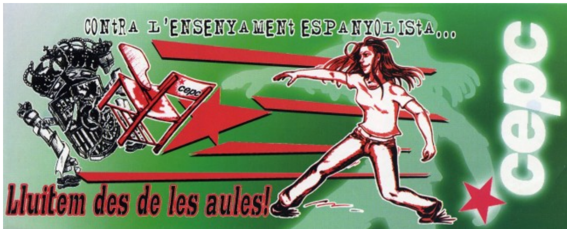
Adhesiu de la Coordinadora d'Estudiants dels Països Catalans (CEPC) de 2004