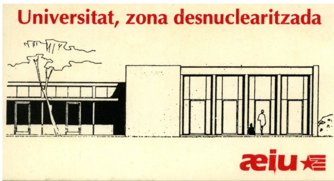
Adhesiu antimilitarista de l'Assemblea d'Estudiants Independentistes d'Universitat (AEIU) de l'any 1988

El llibre, l'edició del qual també ha estat possible gràcies a l'aportació de 350 persones a través d'una campanya popular de micromecenatge, abasta des de la creació del PSAN i les organitzacions que van protagonitzar els primers anys de l'Esquerra Independentista, en els últims anys del franquisme i els primers després de la mort del dictador, com el Col·lectiu de Treballadors dels Països Catalans, les Joventuts Revolucionàries Catalanes, els Comitès de Solidaritat amb els Patriotes Catalans, el Bloc d'Esquerra d'Alliberament Nacional (BEAN) o Terra Lliure, per seguir amb els que van sorgir els anys vuitanta, com l'Assemblea d'Estudiants Independentistes d'Universitat (AEIU) o el Bloc d'Estudiants Independentistes (BEI), Dones Independentistes o el Moviment de Defensa de la Terra (MDT). I ja als anys noranta, Maulets, Catalunya Lliure, Alternativa Estel o els Joves Independentistes (JIR), fins arribar a l'actualitat amb les organitzacions encara existents com la CUP o Arran.