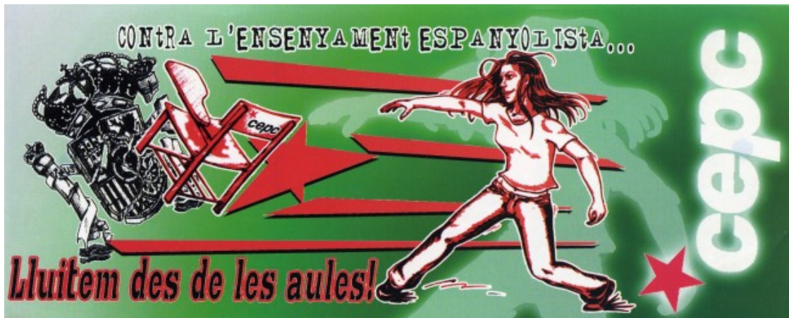
Adhesiu de la Coordinadora d'Estudiants dels Països Catalans (CEPC) de 2004