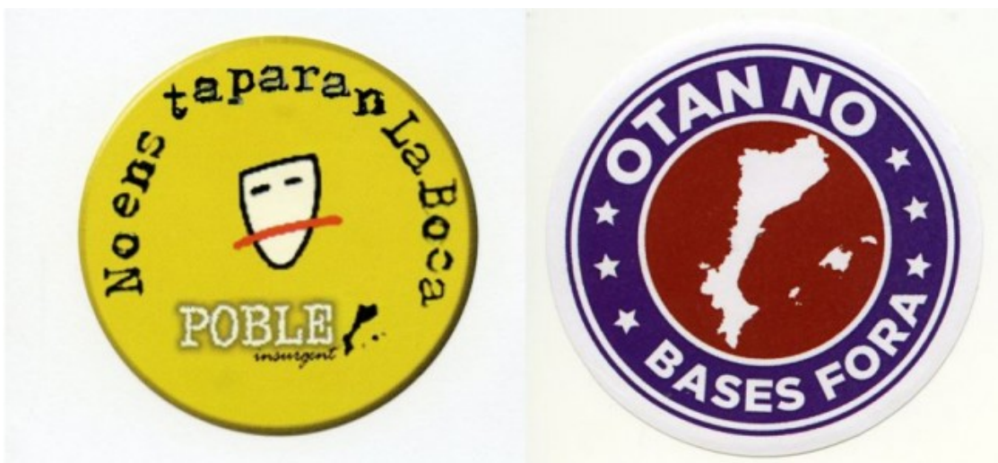
A l'esquerra, adhesiu per la llibertat d'expressió de Poble Insurgent de l'any 2000. A la dreta, un contra l'OTAN i les bases americanes amb motiu del referèndum de l'OTAN de 1986