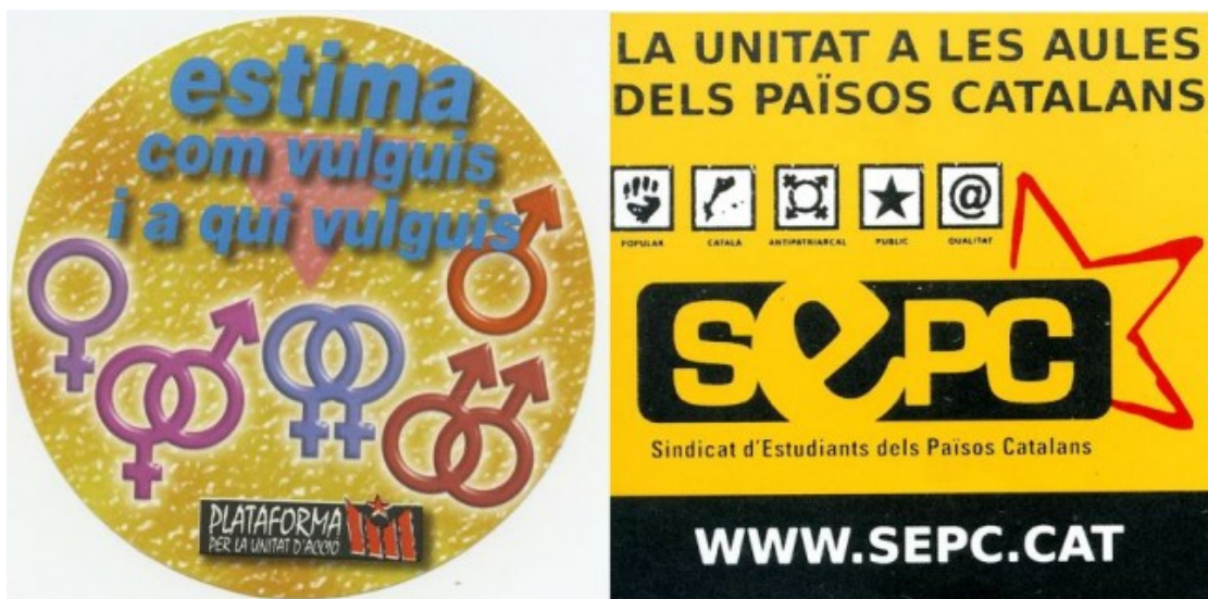
A l'esquerra, adhesiu pels drets LGTBI de la Plataforma d'Unitat d'Acció (PUA) de finals dels noranta. A la dreta, adhesiu del Sindicat d'Estudiants dels Països Catalans (SEPC), de 2006, l'any que va néixer aquesta organització estudiantil fruit de la unió del CEPC i l'Alternativa Estel