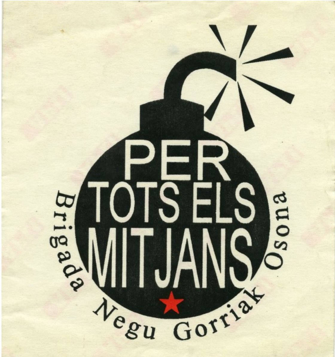
Adhesiu de 1995 de la Brigada Negu Gorriak Osona