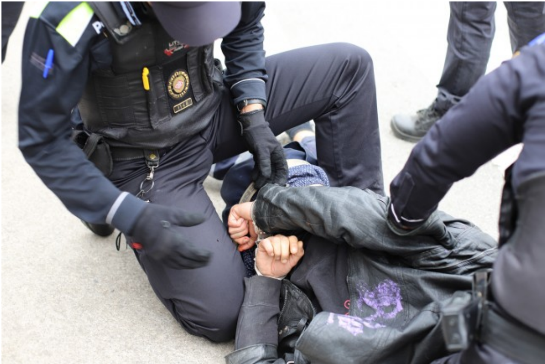
Dos agents sobre una de les persones concentrades per evitar el desmantellament del parc