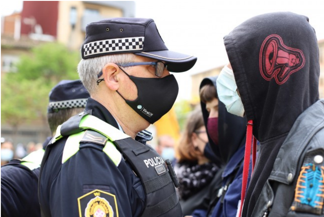
Un agent de la Guàrdia Urbana s'encara a una de les persones manifestants que volien evitar el desmantellament dels jocs infantils

Ha estat aquest dimarts, però, que de bon matí ja s'ha vist que els operaris de la brigada municipal anaven per feina. Un grup reduït de veïnes també s'ha concentrat a l'interior del recinte tancat, però ha estat desallotjat ràpidament per la Guàrdia Urbana, que en cap moment del matí hi ha tingut menys de deu agents destacats. En algun moment n'hi ha hagut una quinzena, quan les persones concentrades dins el recinte d'obres no ha passat mai de la dotzena.