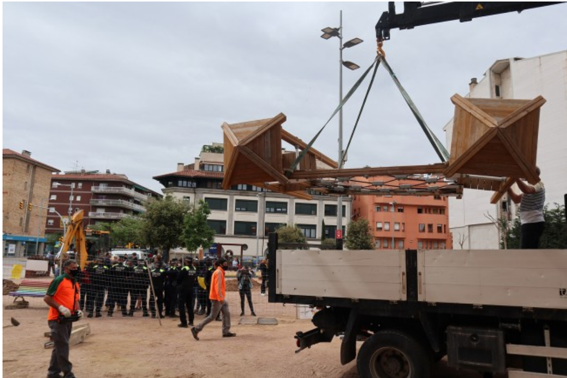
Moment de la càrrega al camió de la brigada del 'castell' dels jocs infantils, amb la concentració i el dispositiu policial al fons