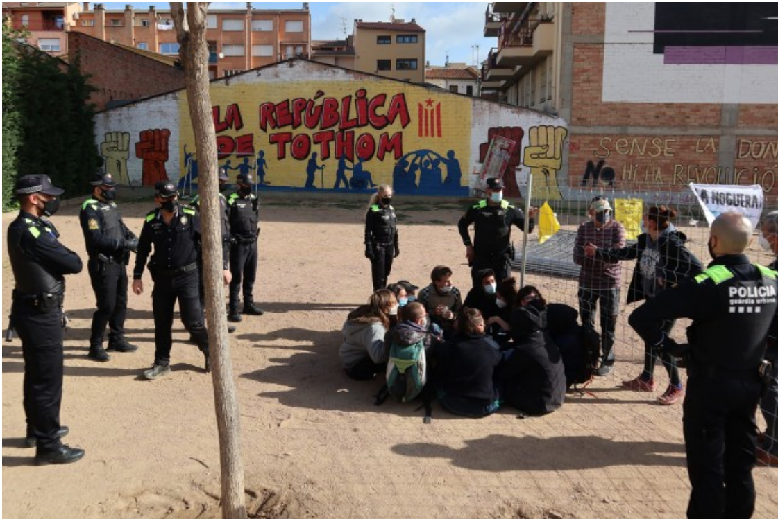
Una dotzena d'agents de la Guàrdia Urbana per controlar que el veïnat no s'acostés als operaris que desmuntaven el parc infantil