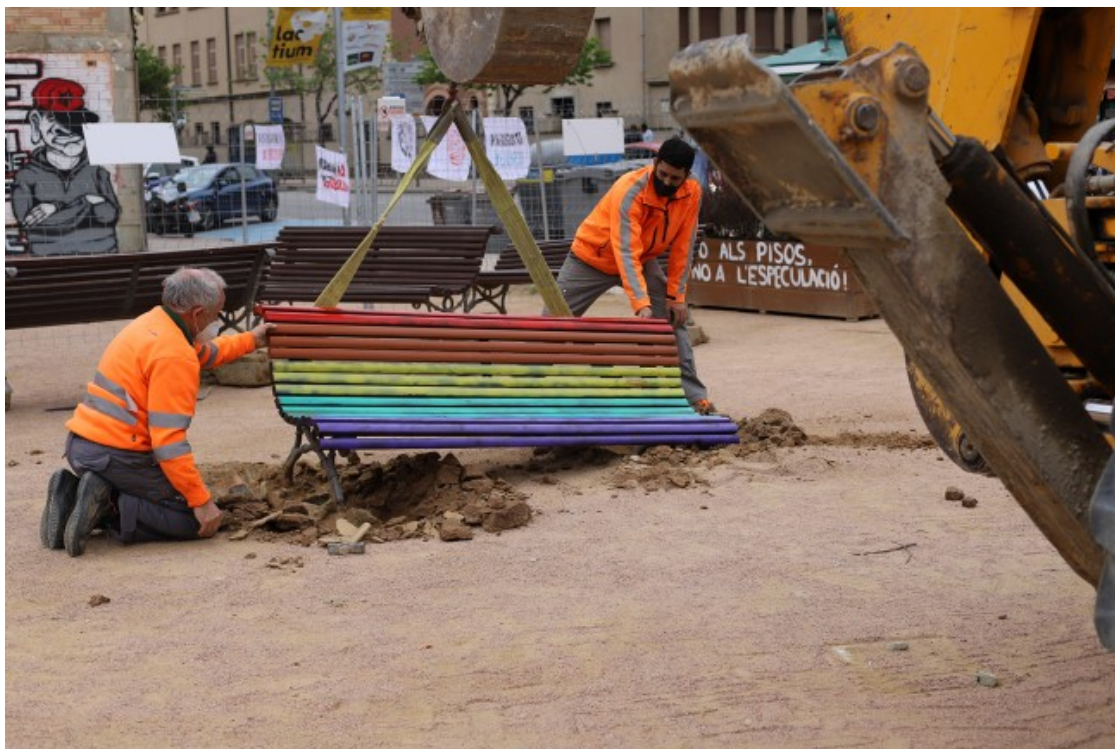
Operaris de l'Ajuntament de Vic recol·loquen un banc que han arrencat de la zona on es faran els pisos

Arran del rebombori que s'ha muntat, més d'una persona ha acabat a terra amb més d'un policia a sobre. Una de les persones es queixava que no podia respirar, i una altra, ja emmanillada, sagnava al terra. Al final, la persona emmanillada ha estat carregada dins un cotxe policial i traslladada detinguda a la comissaria. Alerta Solidària s'ha interessat al llarg del matí per la seva situació i pels motius de la seva detenció.