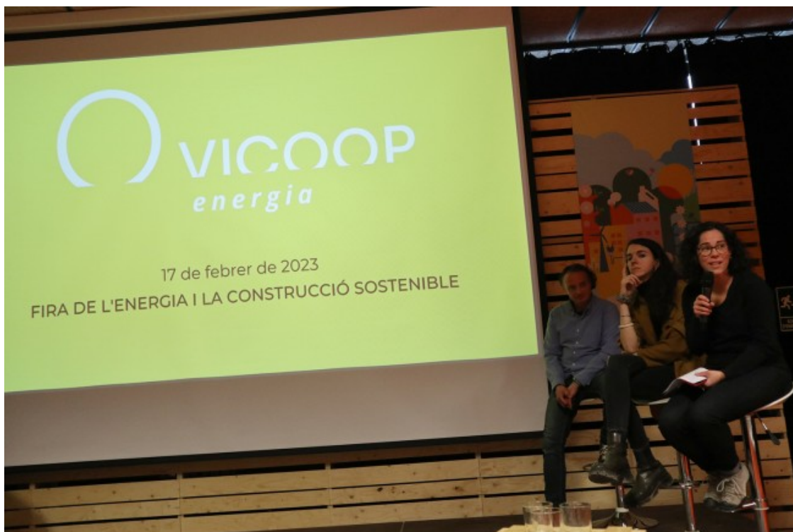
Presentació pública de ViCoop, el 17 de febrer a la Fira de l'Energia i la Construcció Sostenible

Algunes de les mesures fan referència a qüestions com la pobresa energètica i la mobilitat sostenible. I és que la comunitat energètica de Vic també té previst fer èmfasi en altres qüestions més enllà de les més pròpies d'aquest tipus de projectes.